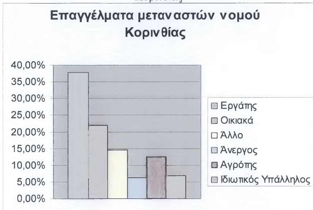
Πίνακας 2 : Ποσοστιαία κατανομή επαγγελμάτων μεταναστών νομού Κορινθίας