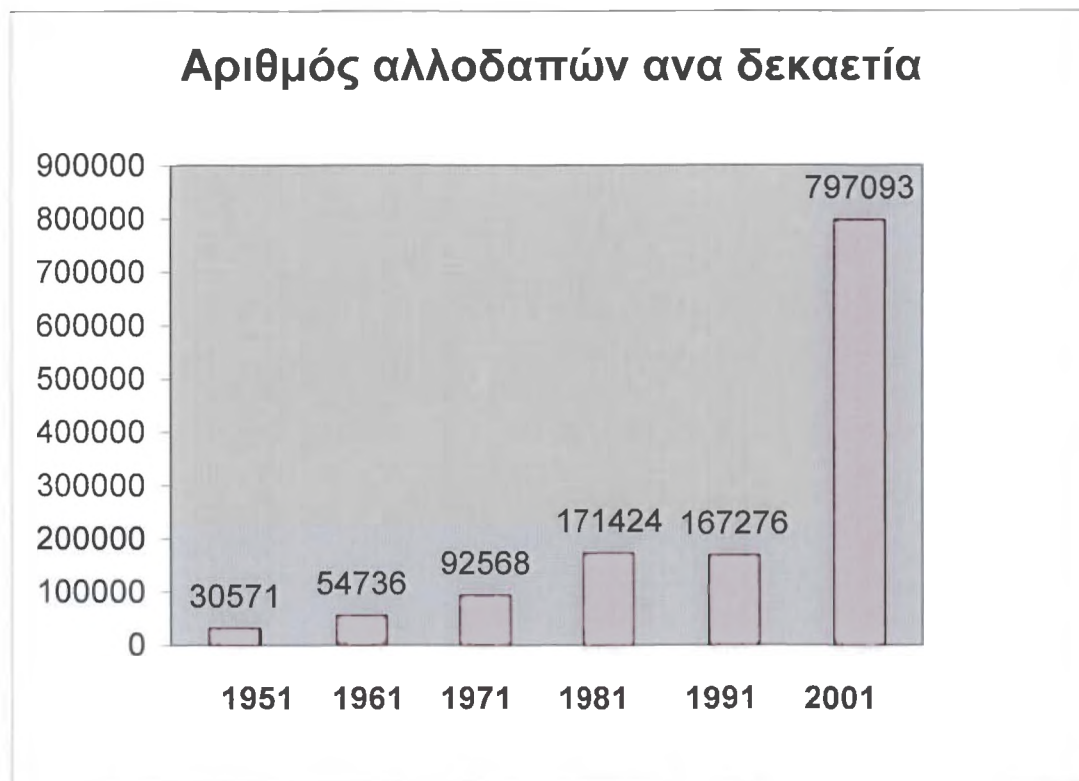
Πίνακας 1 : Αριθμός Αλλοδαπών στην Ελλάδα ανά Δεκαετία***

Πηγή: ΕΣΥΕ, Απογραφές πληθυσμού-κατοικιών