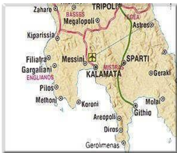
ΔΙΑΔΡΟΜΗ ΠΥΤΡΙΠΟΛΗ - ΓΥΘΕΙΟ

Ένα από τα πιο δημοφιλή μονοπάτια της Ελλάδας αλλά και του εξωτερικού είναι της Πελοποννήσου E4 102 το οποίο ξεκινά από το Αίγιο διασχίζει το Διακοφτό μετά περνά το φαράγγι του Βουραϊκού φτάνει στα Καλάβρυτα και ανεβαίνει το Χελμό. 103