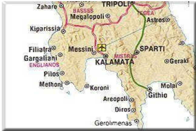
ΔΙΑΔΡΟΜΗ ΠΥΡΗΝΑΙΑ - ΓΥΘΕΙΟ 115