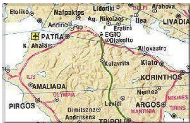
ΔΙΑΔΡΟΜΗ IV ΔΕΛΦΟΙ - ΤΡΙΠΟΛΗ