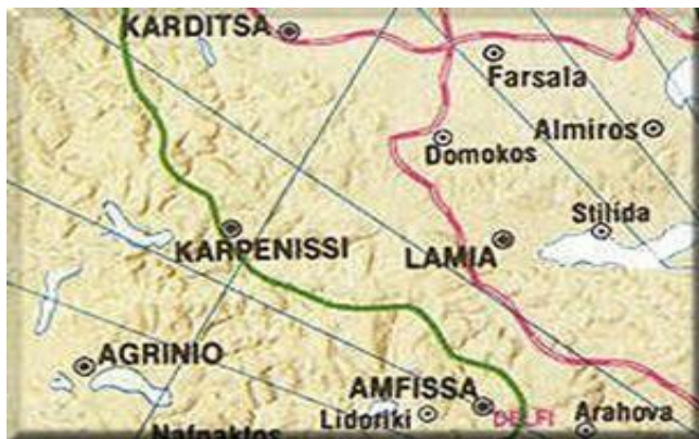
ΔΙΑΔΡΟΜΗ III ΚΑΡΔΙΤΣΑ - ΔΕΛΦΟΙ