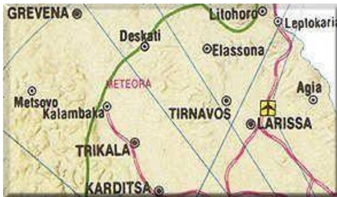
ΔΙΑΔΡΟΜΗ II ΛΙΤΟΧΩΡΟ - ΚΑΡΔΙΤΣΑ