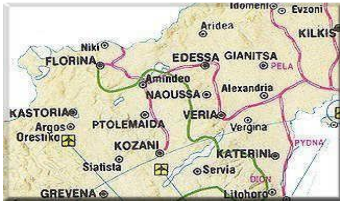
ΔΙΑΔΡΟΜΗ I ΦΛΩΡΙΝΑ- ΛΙΤΟΧΩΡΟ