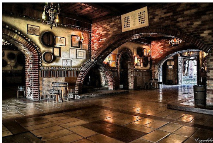
Εικόνα 13 Εσωτερικός Χώρος Achaias Claus

Ο κεντρικός που έχει η Achaia Claus υπάρχει η δυνατότητα να τον επισκεφθεί ο κάθε ένας και στο συγκεκριμένο σημείο έχει φυλαχθεί και το γραφείο του Κλάους. Υπάρχουν πάρα πολλές φωτογραφίες οι οποίες είναι ασπρόμαυρες και παρουσιάζουν τους θρυλικούς πολιτισμούς που είχε η Ελλάδα όπως και το εξωτερικό και από τις προηγούμενες δεκαετίες παρουσιάζει τα αστέρια του Hollywood να καταναλώνουν μαυροδάφνη και ορισμένα άλλα κρασιά τα οποία είναι η ιστορία για την εταιρεία Achaia Claus.