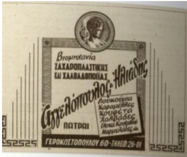
Εικόνα 16 Βιομηχανία Λουκουμιών Αδερφών Αγγελόπουλοι