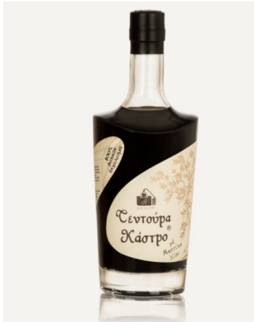
Εικόνα 8 Τεντούρα με Μαστίχα

λάβει χώρα στο Δημοκρίτειο Πανεπιστήμιο της Θράκης (Στιβαχοπούλου – Σταυρίδη, 2020).