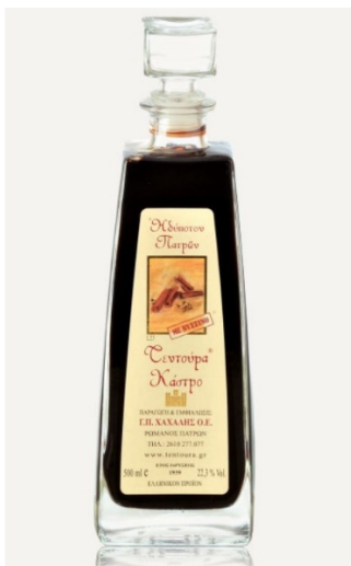
Εικόνα 10 Τεντούρα με Βύσσινο