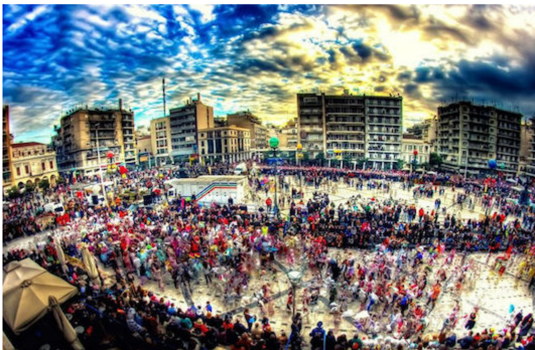
Εικόνα 3 Καρναβάλι Πάτρας

τύπο υπήρχε η διάδοση του άμεσα και οι επισκέπτες γινόταν ακόμη πιο πολλοί. Η διάδοση του από τα μέσα κατάφερε να προσελκύει και ξένο κόσμο και μέσω της κατάλληλης διαφήμισης κατάφερε να βελτιωθεί και με αυτό τον τρόπο κατάφερε να γίνει ένας θρύλος (Βερέττας, 2004).