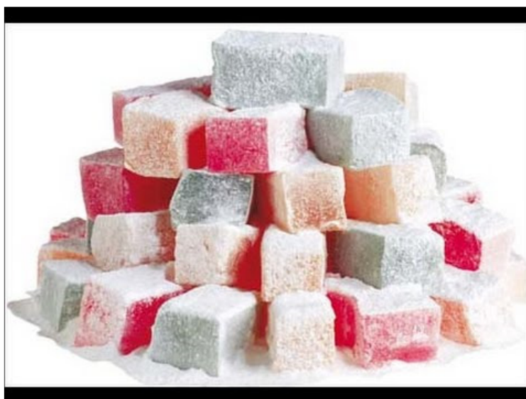
Εικόνα 15 Λουκούμια Πάτρας

Τα λουκούμια είναι μια παράδοση για την Ελλάδα και πιο συγκεκριμένα για την Πάτρα, αφού η παρασκευή τους χρονολογείται από το έτος 1800 κάνοντας το ένα προϊόν μοναδικό και μια σπεσιαλιτέ της περιοχής. Είναι, συνάμα με την τεντούρα, το σήμα κατατεθέν για την Πάτρα. Το σχήμα που έχουν είναι μικροί κύβοι, τα υλικά που χρησιμοποιούνται είναι φυσικά και τις πιο πολλές φορές περιέχουν αμύγδαλα, ένα άρωμα το οποίο είναι πάρα πολύ ιδιαίτερο και η υφή που έχουν είναι βελούδινη. Η ιστορία που έχει το λουκούμι για την περιοχή, έχει ως αρχή το έτος 1850 όπου τα εργαστήρια παραγωγής λουκουμιών παρουσίαζαν ακμή, με συνέπεια να γίνει ένα έδρασμα όπου κατείχε την αρχική θέση στις σπεσιαλιτέ που έχει η Πάτρα. Τον 19 ο αιώνα ένας άνθρωπος από την Αγγλία είχε περάσει στην Πάτρα και αγόρασε λουκούμια όπου τα μετέφερε στην χώρα του και στην συνέχεια σε ολόκληρο τον κόσμο, με συνέπεια η Πάτρα να είναι για τον κόσμο της Δύσης την πύλη του λουκουμιού (Κονταρίνης, 2020).