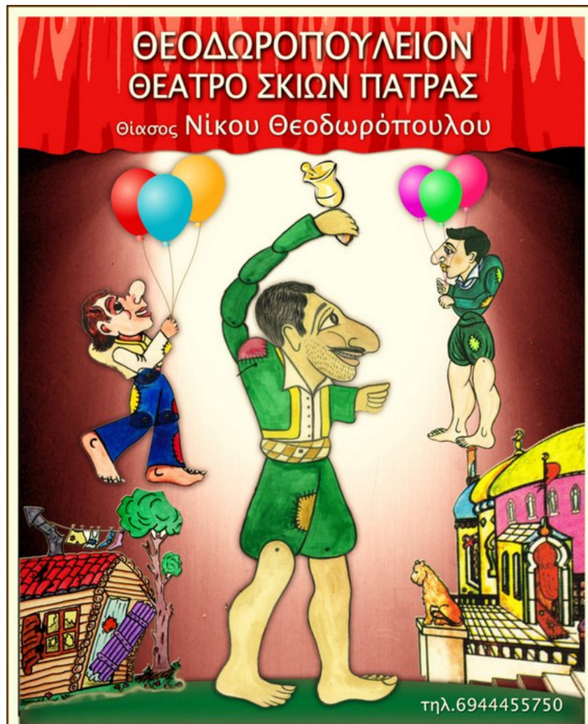
Εικόνα 2 Θέατρο Σκιών Πάτρας "Καραγκιόζης"

Στην Ελλάδα η διάδοση που αφορά τον πολιτισμό της Ελλάδας και την αφοσίωση της τέχνης μέσω του θεάτρου σκιών, οφείλεται στον πατρινό ψάλτη εν ονόματι Σαρδούνης Δημήτρης, όπου στα καλλιτεχνικά είναι γνωστός σαν Μίμαρος. Εκείνος είναι ο οποίος είχε δώσει ορισμένα από τα βασικά χαρακτηριστικά στοιχεία ως Καραγκιόζης, σύμφωνα με τα οποία το θέαμα έχει συνδεθεί με την παράδοση της Ελλάδας και με την ιστορία που έχει, αποκτώντας με αυτό τον τρόπο ένα ελληνικό χαρακτήρα. Ακόμη, μέσω των συγκεκριμένων χαρακτηριστικών, έχει μετατραπεί σε θέατρο το οποίο είναι δημοφιλές ακόμη και για τις οικογένειες (Κόρκα, 2018).