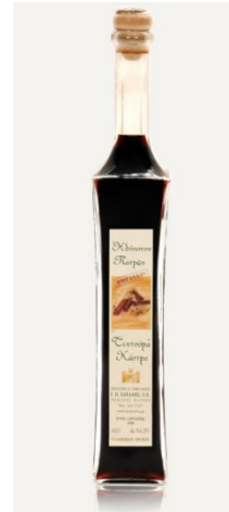
Εικόνα 9 Τεντούρα Ημίγλυκο