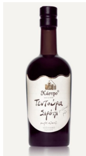
Εικόνα 11 Τεντούρα Σιρόπι