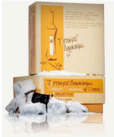
Εικόνα 12 Τεντούρα Λουκούμι