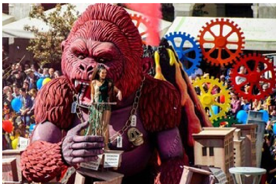
Εικόνα 4 Ο Βασιλιάς Καρνάβαλος & η Βασίλισσα

όμορφη και έχει το ρόλο της βασίλισσας του καρναβαλιού. Πλέον, η τελετή της λήξης είναι στο λιμάνι, γίνεται σύμφωνα με την παράδοση η καύση του βασιλιά καρνάβαλου (Πολίτης, 1987).