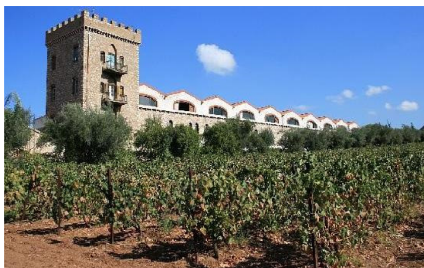
Εικόνα 14 Οινοποιείο Achaia Claus