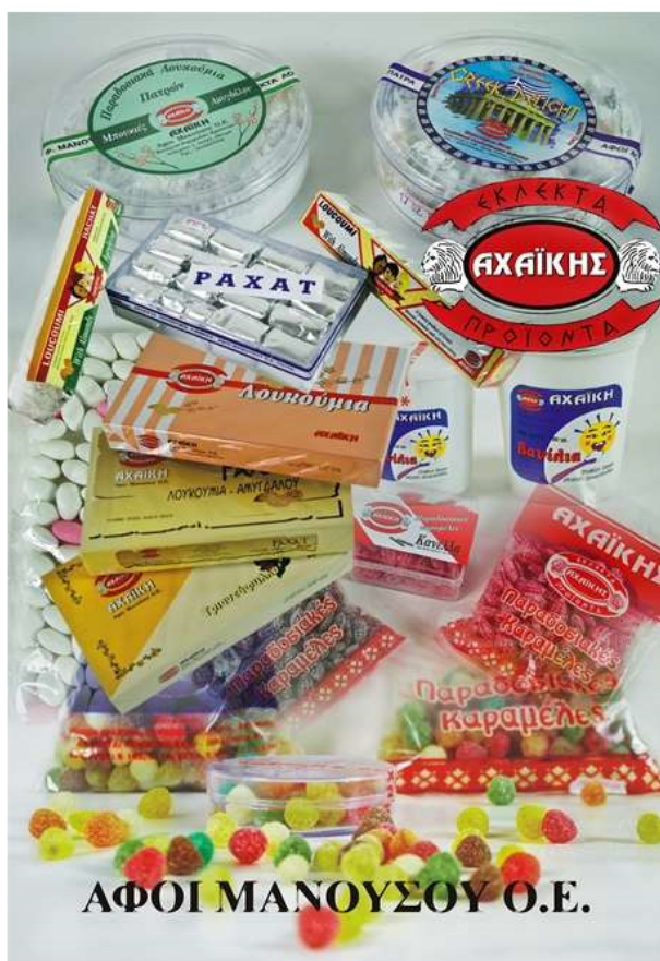
Εικόνα 18 Προϊόντα Αχαϊκή