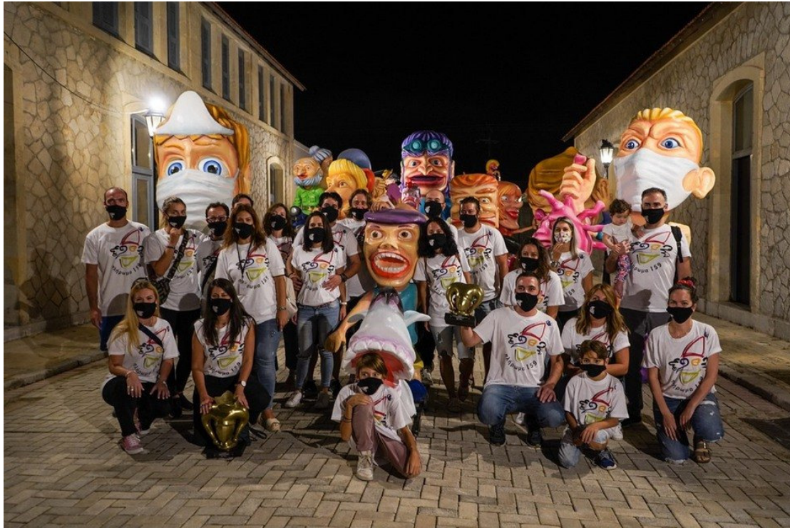
Εικόνα 5 Παιχνίδι Κρυμμένου Θησαυρού Πάτρα

Ακόμη και σήμερα, κάθε έτος πραγματοποιείται στην Πάτρα πρόγραμμα όπου αφορά τις δραστηριότητες και τις εκδηλώσεις που περιέχονται στο καρναβάλι. Λειτουργεί σαν ένα εργαστήριο όπου υπάρχουν οι κατασκευές του καρναβαλιού και γενικά καλύπτεται κάθε ανάγκη όπου έχει η εκδήλωση. Κάθε κατασκευή, διαθέτει μια πολύ ιδιαίτερη καρναβαλική τεχνοτροπία και μια αισθητική όπου χρειάζεται να προβάλλεται προς τα έξω. Η προσφορά που έχει το καρναβάλι της Πάτρας έχει πολύ μεγάλη σημαντικότητα, όπου χρειάζεται να εφαρμόζονται ορισμένες πολιτικές ώστε να μπορέσει να αναπτυχθεί όσο γίνεται πιο πολύ, να αναδεικνύεται καθώς και να προστατεύεται ο συγκεκριμένος θεσμός στο πέρασμα των ετών ( carnivalpatras.gr )