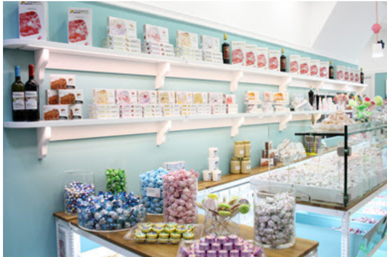
Εικόνα 19 Λουκούμια Σκιαδαρέσης

και το λουκούμι από τεντούρα, όπου έχει Πάτρα πολλά στοιχεία αρώματος της τεντούρας και είναι μια επιλογή όπου έχει την δυνατότητα να συνδυάσει δυο στοιχεία τα οποία αφορούν τον άυλο πολιτισμό της Πάτρας.