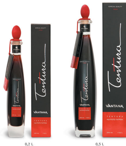
Εικόνα 7 Τεντούρα

γλυκιά, είναι ευχάριστη και η έχει σημαντική περιεκτικότητα στο αλκοόλ. Η παρασκευή της διενεργείται με ποικίλους τύπους αποσταγμάτων, όπως παραδείγματος χάριν από το ρούμι, από το μπράντι ή από αλκοόλ ποτοποιίας όπου περιέχει μπαχαρικά και βότανα με την διαδικασία της εκχύλισης ή του αρωματισμού. Τα κύρια χαρακτηριστικά που έχει η τεντούρα, είναι το γαρύφαλλο όπως και η κανέλα, όμως υπάρχει περίπτωση να περιέχονται και εκχυλίσματα από εσπεριδοειδή, μοσχοκάρυδο ή μαστίχα Χίου. Το χρώμα που έχει είναι μαύρο και υπάρχει δυνατότητα να το απολαύσει κάποιος σκέτο ή σαν απεριτίφ με πάγο ή έπειτα από το φαγητό για χώνεψη, λόγω των συστατικών στοιχείων που έχει μπορεί ακόμη και να χρησιμοποιηθεί σε φαγητά ή σε γλυκά ή σε αρωματικά, όπως για παράδειγμα στον καφέ ή σε ποικίλα κοκτέιλ σαν συστατικό (Στθβαχτοπούλου – Σταυρίδη, 2020).