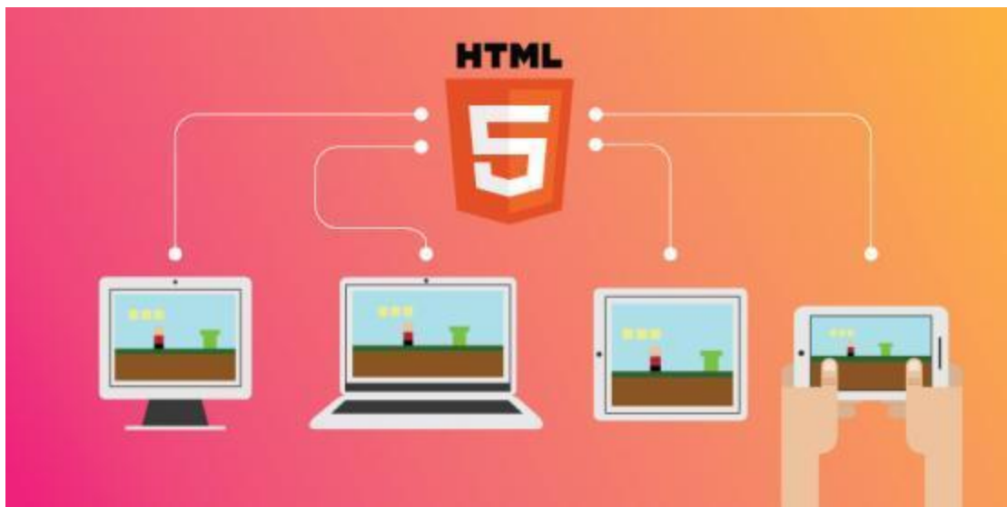
Εικόνα 31 HTML5

Η HTML5 είναι μία γλώσσα σήμανσης (markup language) για τη δόμηση και την παρουσίαση περιεχομένων στον παγκόσμιο ιστό. Αποτελεί την πέμπτη έκδοση της HTML και η αρχική της κυκλοφορία έγινε στις 28 Οκτωβρίου 2014. Οι κύριοι στόχοι της είναι να βελτιώσουν τη γλώσσα, εισάγοντας υποστήριξη νέων πολυμέσων επιτρέποντας με αυτό τον τρόπο την δημιουργία σύνθετων εφαρμογών web. Παράλληλα, βασική επιδίωξη είναι η εύκολη αναγνωσιμότητα από τους προγραμματιστές αλλά και από υπολογιστές και συσκευές (φυλλομετρητές, αναλυτές, μηχανές αναζήτησης κ.α.). Ενσωματώνει όλη την HTML4, την XHTML 1 και το επίπεδο 2 του μοντέλου αντικειμένων εγγράφου (DOM-Document Object Model), σε μία προσπάθεια να μειώσει τις προδιαγραφές που απαιτούνταν μέχρι πρότινος για την επεξεργασία και εμφάνιση των δεδομένων μέσα από διαφορετικής σύνταξης κώδικες. Εισάγει τη διασύνδεση προγραμματισμού εφαρμογών (Application Programming Interface) για πολυσύνθετες εφαρμογές διαδικτύου και είναι ιδανική για χρήση σε διαφορετικούς τύπους κινητών συσκευών.