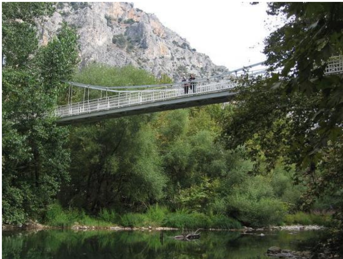
Εικόνα 13 Κοιλάδα Τεμπών

Επιπρόσθετα είναι καλό να γνωρίζουν οι επισκέπτες των οικολογικά ευαίσθητων περιοχών ότι οφείλουν προσεκτικά να τηρούν τις απαιτήσεις για την προστασία του περιβάλλοντος κατά κύριο λόγο από την ρύπανση. Έπειτα είναι πολύ σημαντικό το γεγονός της αποφυγής οποιασδήποτε ενόχλησης των φυσικών βιοτόπων αλλά και διατάραξης της ισορροπίας των οικοσυστημάτων.