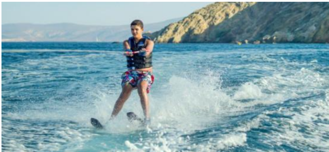
Εικόνα 24 Θαλάσσιο σκι

Το θαλάσσιο σκι «γεννήθηκε» γύρω στο 1900, από μια παρέα νεαρών που διασκεδάζε στα νερά μιας λίμνης των Η.Π.Α. Γρήγορα η μόδα εξαπλώθηκε, ενώ με την εμφάνιση όλο και πιο δυνατών μηχανών στα σκάφη, αυξήθηκε η ταχύτητα, η δυσκολία αλλά και η δημοφιλία του αθλήματος. Στην Ελλάδα, ο Ναυτικός Όμιλος Βουλιαγμένης (στην περιοχή της Αττικής) ήταν το πρώτο σωματείο, που το 1957 ίδρυσε τμήμα θαλάσσιου σκι, ενώ το 1963 ιδρύθηκε η Ελληνική Ομοσπονδία Θαλάσσιου Σκι, με στόχο τη διάδοση του αθλήματος στη χώρα.