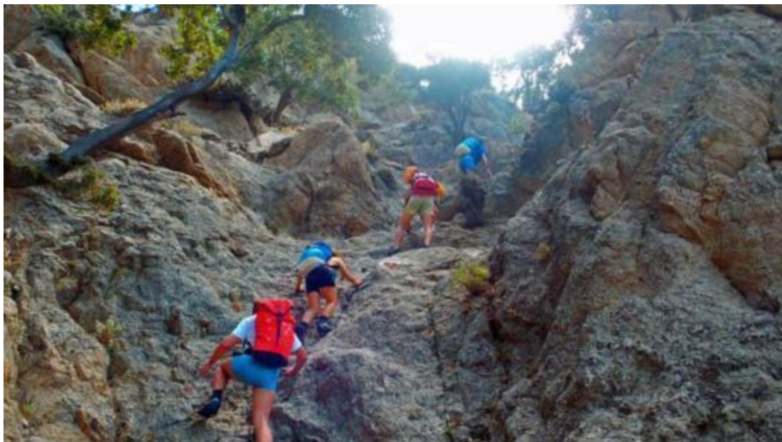
Εικόνα 19 Ορειβασία