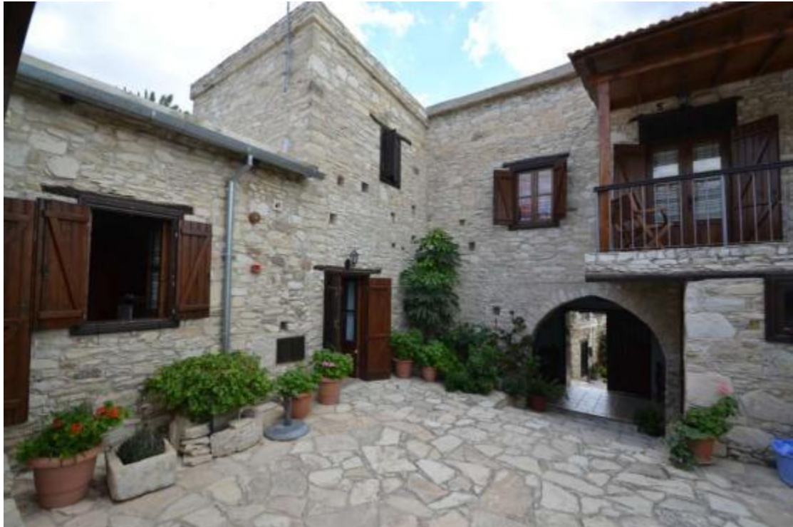
Εικόνα 16 Αγροτοριστικά καταλύματα

Εύκολα γίνεται αντιληπτό πως η απαιτούμενη υποδομή αγροτουρισμού είναι μικρής κλίμακας, συγκρινόμενη με εκείνη του μαζικού τουρισμού. Ο αγροτουρισμός δεν απαιτεί εξελιγμένη τουριστική υποδομή, τουλάχιστον στα πρώτα στάδια ανάπτυξής του. Παράλληλα η προσφορά των προϊόντων είναι άφθονη, καθώς αυτά είναι κατά κύριο λόγο ελεύθερα αγαθά (αέρας, νερό, φύση).