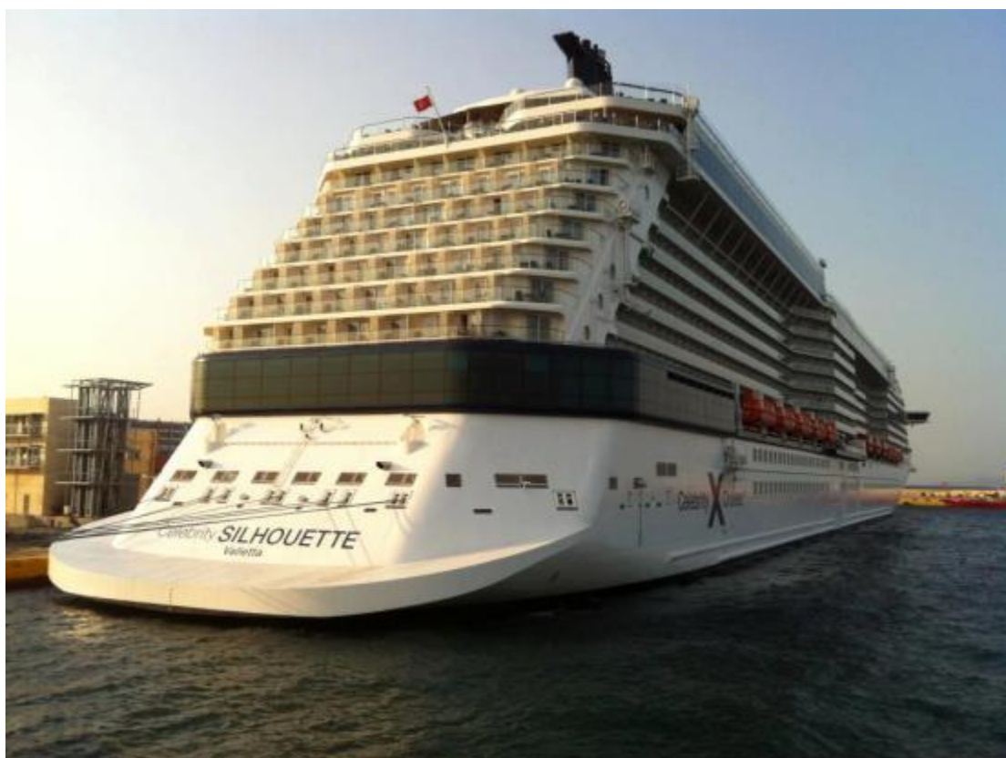
Εικόνα 28 Κρουαζιερόπλοιο στο λιμάνι του Πειραιά

Η Ελλάδα, ως τουριστικός προορισμός, αποτελεί ιδιλλιακό χώρο για να πραγματοποιήσετε ολιγοήμερες ή πολυήμερες κρουαζιέρες, καθώς διαθέτει πολλά νησιά και λιμάνια που μπορείτε να επισκεφθείτε, αλλά και ιδανικό κλίμα, το οποίο επιτρέπει ένα ευχάριστο ταξίδι τις περισσότερες εποχές του χρόνου. Επιπλέον, μια κρουαζιέρα στις ελληνικές θάλασσες σας δίνει την ευκαιρία να επισκεφθείτε σημαντικούς αρχαιολογικούς χώρους, μοναδικές εκκλησίες και μοναστήρια, μνημεία νεώτερων χρόνων, εξαιρετικά ενδιαφέροντα μουσεία και παραδοσιακούς οικισμούς αλλά και να απολαύσετε τις φυσικές ομορφιές πολλών περιοχών της χώρας. Στην Ελλάδα λειτουργούν αρκετές εταιρείες, που διοργανώνουν κρουαζιέρες στις ελληνικές θάλασσες και νησιά, ενώ και ξένες εταιρείες δραστηριοποιούνται στον τομέα αυτό.