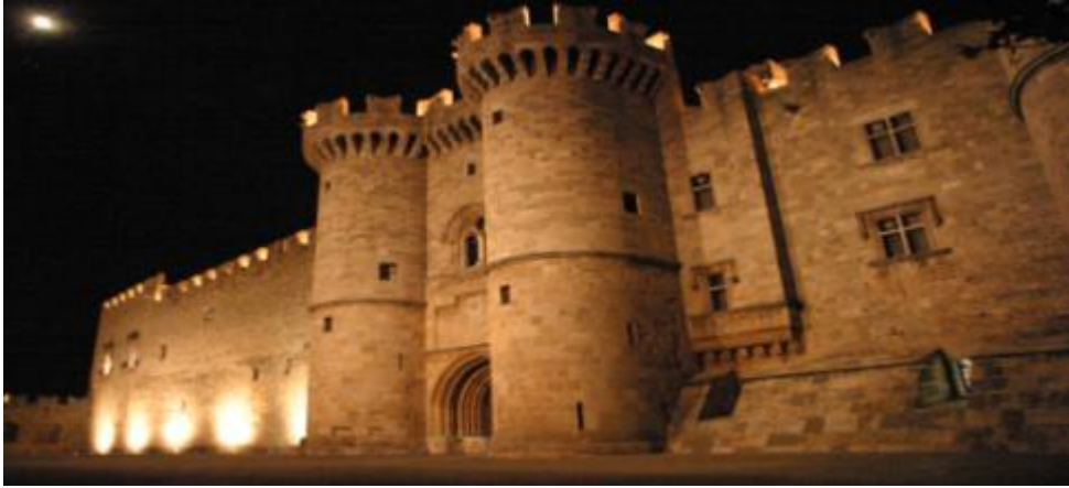
Εικόνα 5 Θαλασσινή Πύλη (Κάστρο Ρόδου)