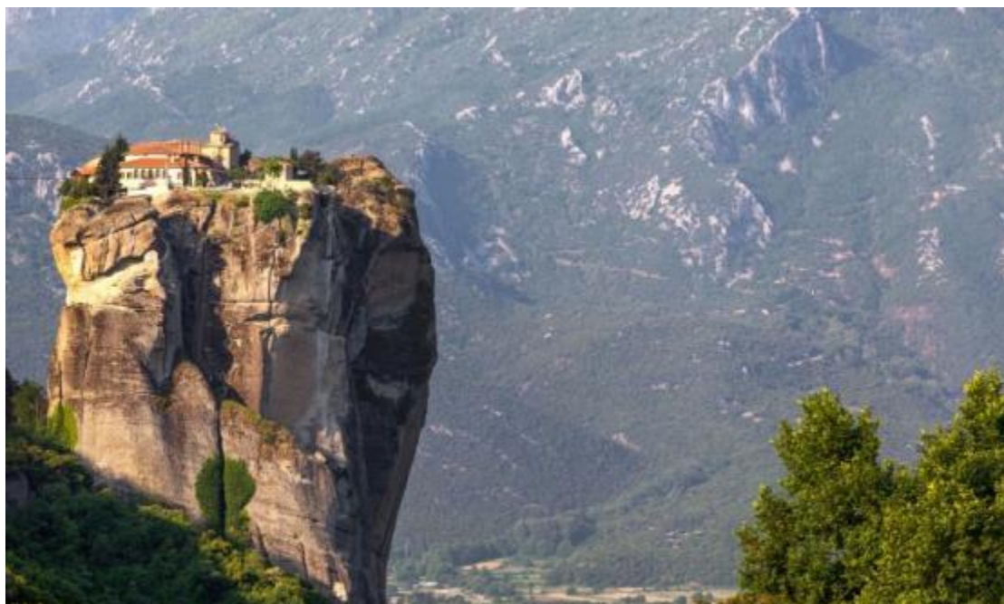
Εικόνα 11 Μονή στα Μετέωρα

Σημαντικά μοναστικά μνημεία αποτελούν επίσης και η Μονή Δαφνίου στην Αττική (11 ος αιώνας), ο Όσιος Λουκάς στη Φωκίδα (11 ος αιώνας), η Νέα Μονή Χίου (11 ος αιώνας), κλπ.