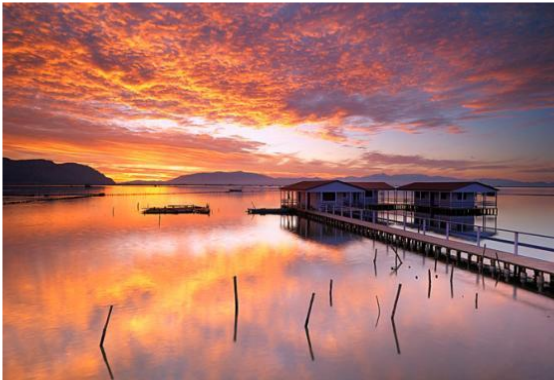
Εικόνα 14 Λιμνοθάλασσα Μεσολογγίου