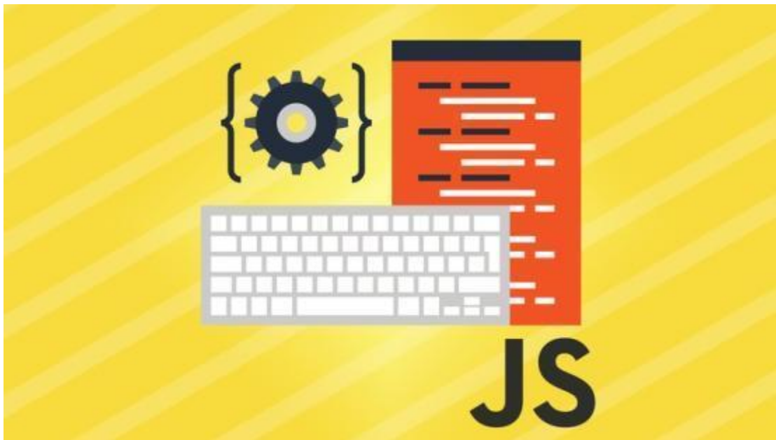
Εικόνα 37 JavaScript

Η JavaScript είναι μία αντικειμενοστραφής γλώσσα προγραμματισμού, η οποία ενσωματώνεται στην HTML, έχει σκοπό την παραγωγή δυναμικού περιεχομένου. Η διαφορά της από την PHP έγκειται στο γεγονός ότι ο κώδικας εκτελείται στην πλευρά του χρήστη (client side) και όχι του διακομιστή (server side). Η σύνταξή της βασίζεται στη γλώσσα προγραμματισμού C και έχει δανειστεί αρκετά στοιχεία από τη Java. Η δυναμική της JavaScript βασίζεται στο γεγονός ότι μπορεί να διαχειριστεί το DOM της HTML σε συνδυασμό με τη διαχείριση γεγονότων (event handling) που σχετίζονται με τα αντικείμενα αυτά. Έτσι κάθε φορά που ο χρήστης αλληλοεπιδρά με κάποιο στοιχείο της ιστοσελίδας η JavaScript μπορεί να παράγει νέα αποτελέσματα και να εμπλουτίζει την εμπειρία πλοήγησης του χρήστη.