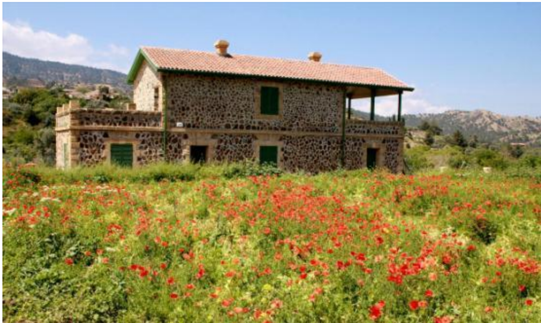
Εικόνα 15 Αγροτουρισμός

Αγροτουρισμός ονομάζεται η εναλλακτική εκείνη μορφή τουρισμού η οποία αναπτύσσεται σε αγροτικές περιοχές με μικρή τουριστική κίνηση. Ακόμα έχει άμεση σύνδεση με κοινωνικές, περιβαλλοντικές και πολιτισμικές αξίες, οι οποίες επιτρέπουν τόσο στους «οικοδεσπότες» όσο και στους «φιλοξενούμενους» των περιοχών αυτών να αλληλοεπιδρούν και να μοιράζονται τις εμπειρίες τους. Αναπτύσσεται κάτοικους περιοχών που δραστηριοποιούνται κυρίως στον πρωτογενή τομέα παραγωγής και χρησιμοποιούν τον αγροτουρισμό ως συμπληρωματική πηγή εισοδήματος. Δυνητικοί και υποψήφιοι πελάτες είναι άτομα που στις διακοπές τους αναζητούν αυτό που στον τουρισμό ονομάζεται «φόρμουλα των 3Φ» (Φύση-Φιλία-Φιλοξενία) σε αντιδιαστολή με εκείνους που αποζητούν των 3S (Sun-Sea-Sand) του μαζικού τουρισμού, όπως αυτή έχει εξελιχθεί στις μέρες μας. Συνήθως τα άτομα αυτά μοιράζονται πολύ συγκεκριμένα ενδιαφέροντα (φυσιολάτρες, παρατηρητές πουλιών, παρατηρητές χλωρίδας και πανίδας, ορειβάτες κ.ά.) και παρουσιάζουν υψηλή ευαισθητοποίηση σε περιβαλλοντικά αλλά και κοινωνικά ζητήματα.