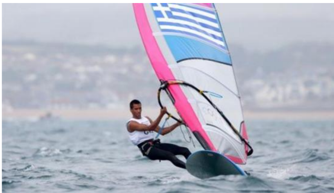
Εικόνα 26 Ιστιοσανίδα

Μάλιστα, τα τελευταία χρόνια, κατά τη διάρκεια των καλοκαιρινών μηνών, πραγματοποιούνται σε διάφορα σημεία της χώρας ευρωπαϊκοί και παγκόσμιοι αγώνες (τουρνουά) και πρωταθλήματα, μερικοί από τους οποίους είναι από τους σημαντικότερους διεθνώς. Στις περισσότερες οργανωμένες παραλίες της χώρας, έχετε τη δυνατότητα να χαρείτε το άθλημα της ιστιοσανίδας ή να πάρετε μαθήματα από εξειδικευμένους εκπαιδευτές.