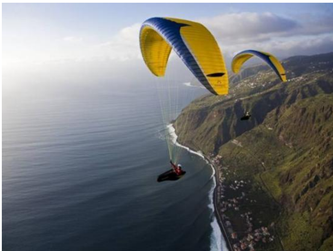
Εικόνα 23 Παραπέντε στον Κιθαιρώνα