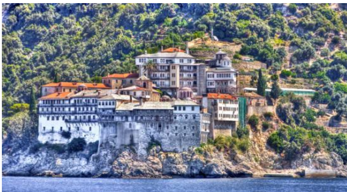
Εικόνα 10 Άγιο Όρος

Τον 4 ο μ.Χ. αιώνα πρωτοεμφανίστηκε από τους αναχωρητές (ή αλλιώς και ασκητές) στην έρημο της Αιγύπτου ο θεσμός του μοναχισμού. Είναι γεγονός ότι πολύ γρήγορα εξαπλώθηκε και σε άλλες περιοχές της τότε βυζαντινής αυτοκρατορίας. Η μεγάλη του ακμή μάλιστα από τον 10 ο μ.Χ. αιώνα συνδυάστηκε με την ίδρυση πολλών μοναστηριών.