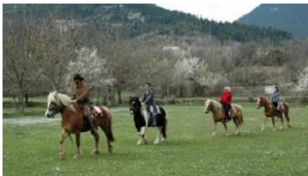
Εικόνα 21 Ιππασία στις Κορυσχάδες Ευρυτανίας

Εκτός από την αγωνιστική ιππασία, μπορεί κάποιος να συμμετάσχει και σε προγράμματα ιππασίας τόσο για έμπειρους όσο και για αρχάριους αναβάτες, τα οποία πραγματοποιούνται σε ειδικά διαμορφωμένους χώρους (ιππικά κέντρα) που βρίσκονται σε διάφορες περιοχές της Ελλάδας. Εκεί, ένα προσωπικό ειδικά εκπαιδευμένο για οποιεσδήποτε καταστάσεις, έχοντας εκπαιδευμένα άλογα, θα αποκαλύψει στα άτομα τα βασικά μυστικά της ιππασίας. Φυσικά πάντα θα τηρούνται όλοι οι κανόνες ασφάλειας, ενώ φυσικά δίνεται και η δυνατότητα να πραγματοποιηθούν και ιππικές διαδρομές σε φυσικά μονοπάτια και πανέμορφους ορεινούς όγκους διάρκειας μερικών ωρών.