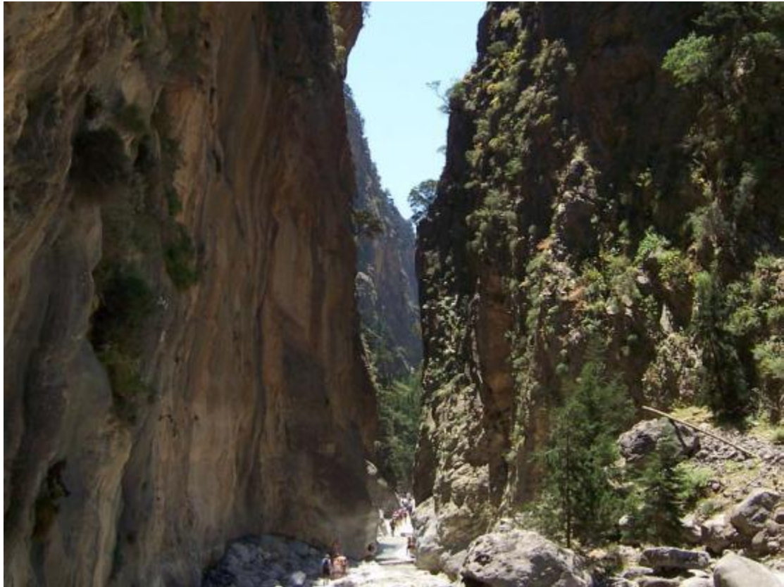
Εικόνα 18 Το φαράγγι της Σαμαριάς