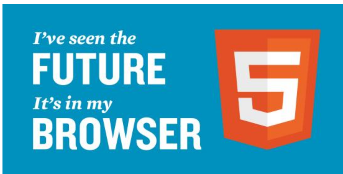
Εικόνα 32 Το μέλλον είναι η HTML5

στη νέα έκδοση χωρίς να είναι απαραίτητη η εγκατάσταση επιπρόσθετων λογισμικών (plugins). Μία ακόμα πολύ σημαντική αλλαγή είναι η προσθήκη στοιχείων τα οποία χαρακτηρίζουν όλες τις ενότητες του εγγράφου (<main>, <section>, <article>, <header>, <footer>, <aside>, <nav>, <figure> κ.α.). Αυτά επιτρέπουν την χαρτογράφηση του εγγράφου, η οποία επιτρέπει στις συσκευές να αναγνωρίζουν σε ποιο σημείο του εγγράφου βρίσκονται είτε αυτό είναι η κεφαλίδα, το κυρίως κείμενο ή το υποσέλιδο. Τέλος, ορισμένα στοιχεία όπως τα <a>, <cite> και <menu> έχουν καταργηθεί ή επαναδιατυπωθεί.