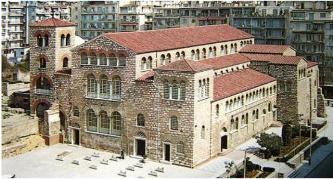
Εικόνα 9 I.N. Αγ. Δημητρίου στη Θεσσαλονίκη

Έπειτα, οι εκκλησίες της μετα-βυζαντινής περιόδου (δηλαδή 1204 - 1453) συνεχίζουν τους παραδοσιακούς αρχιτεκτονικούς τους τύπους. Μάλιστα ορισμένοι από τους πιο σημαντικούς ναούς που κτίστηκαν αυτή την περίοδο βρίσκονται στην Άρτα, στη Βέροια, στη Θεσσαλονίκη, στη Καστοριά και στο Μιστρά. Οι εκκλησίες που κατασκευάστηκαν σε περιοχές υπό ενετική ή φραγκική κατοχή εκείνη τη περίοδο υιοθέτησαν αρκετά αρχιτεκτονικά και διακοσμητικά στοιχεία από τη δύση.