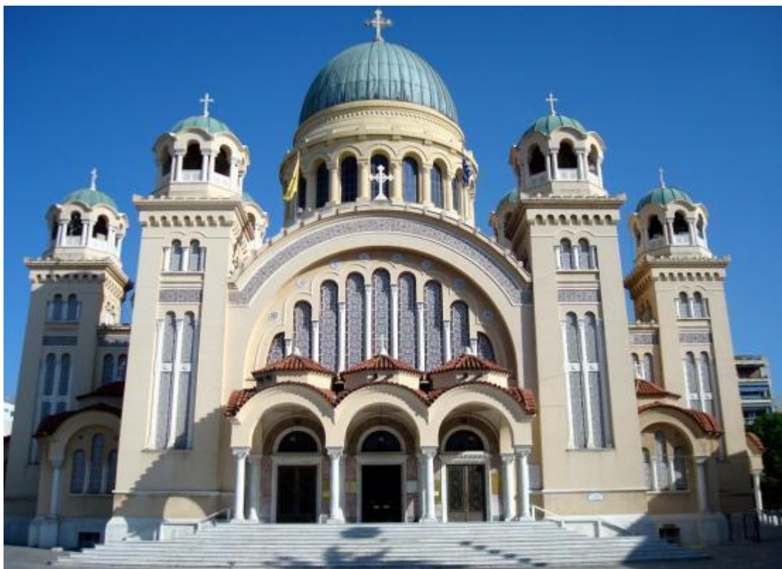
Εικόνα 8 Ι.Ν. Αγίου Ανδρέα στην Πάτρα