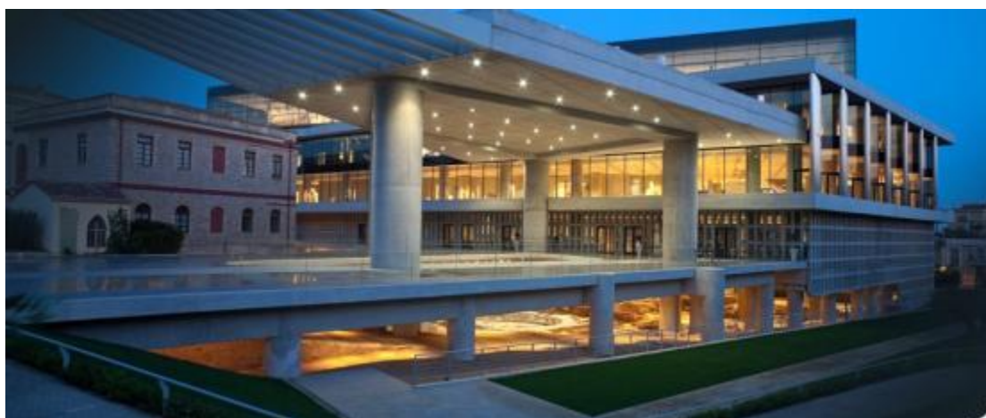
Εικόνα 3 Μουσείο Ακρόπολης