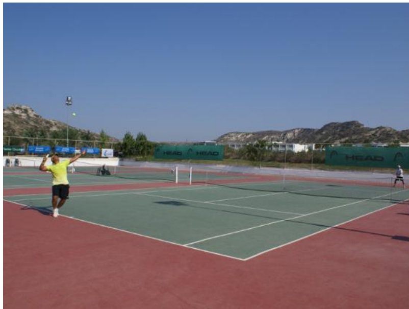
Εικόνα 22 Γήπεδο τένις σε ξενοδοχείο της Κω

Επίσης αξίζει να αναφερθεί ότι το ήπιο κλίμα της χώρας βοηθά σημαντικά στην εξάσκηση του συγκεκριμένου σπορ, ενώ πολλές ξενοδοχειακές μονάδες έχουν πλέον ειδικές εγκαταστάσεις για τένις, εκτός από τα γήπεδα που διαθέτουν έτσι κι αλλιώς οι κατά τόπους σύλλογοι αντισφαίρισης.