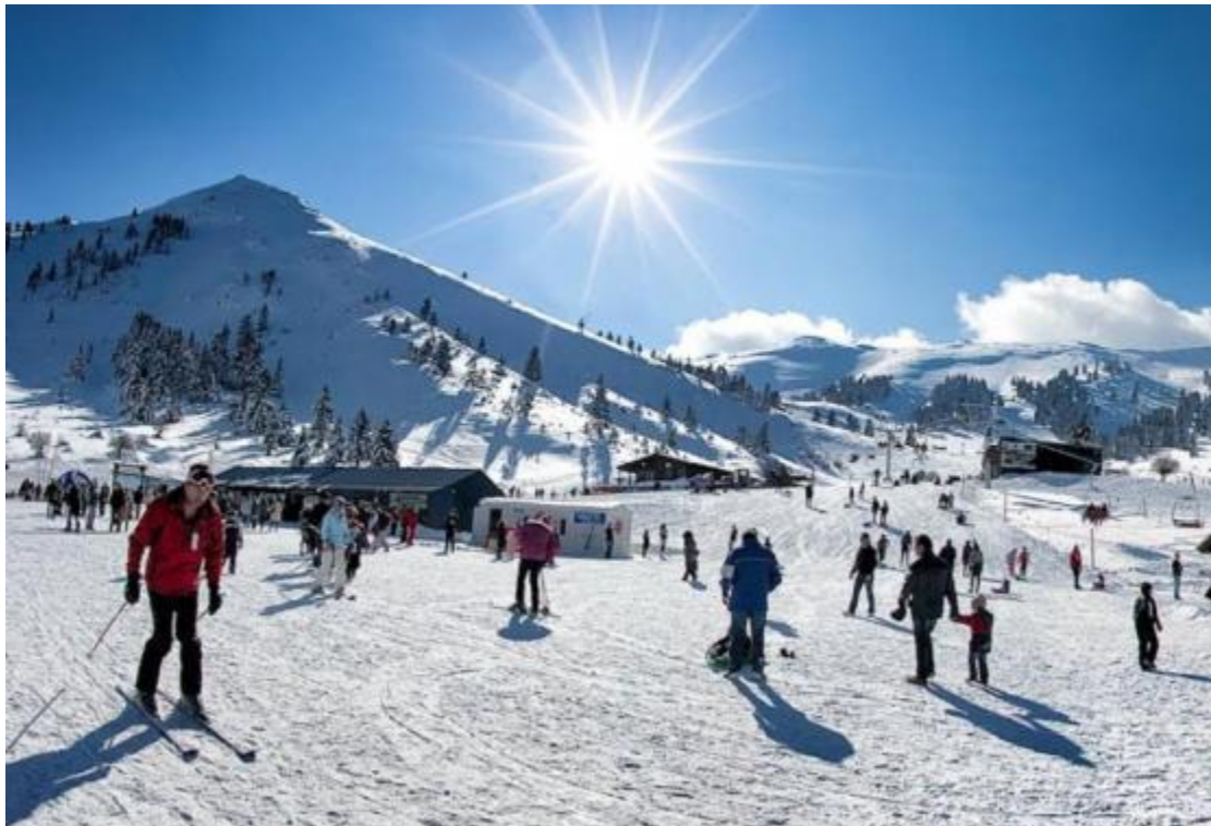
Εικόνα 20 Χιονοδρομικό κέντρο Καλαβρύτων

Ως χιονοδρομικό τουρισμό ορίζουμε την εναλλακτική εκείνη μορφή τουρισμού κατά τη διάρκεια της οποίας οι τουρίστες απασχολούνται κυρίως με τις χιονοδρομίες. Κατά τα τελευταία χρόνια, το σκι και, γενικότερα, τα χειμερινά αθλήματα απέκτησαν μεγάλη απήχηση στην Ελλάδα. Αυτή της στιγμή, στο ηπειρωτικό τμήμα της χώρας λειτουργούν 19 χιονοδρομικά κέντρα που πληρούν τις πλέον σύγχρονες προδιαγραφές και είναι οι σημαντικότεροι πόλοι για την ανάπτυξη δραστηριοτήτων χειμερινού τουρισμού. Τα χιονοδρομικά αυτά είναι ιδιαίτερα προσφιλή όχι μόνο στους Έλληνες αλλά και στους ξένους τουρίστες της χώρας.