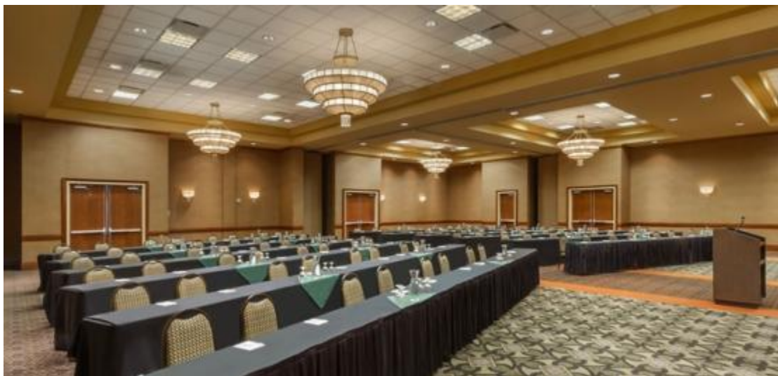
Εικόνα 29 Συνεδριακό κέντρο

Ο επαγγελματικός τουρισμός αντιπροσωπεύει μία σημαντική αγορά σε διεθνές επίπεδο. Η αγορά αυτή αφορά συνήθως επισκέπτες υψηλού εκπαιδευτικού και οικονομικού επιπέδου, οι οποίοι κινούνται σε καταλύματα υψηλών κατηγοριών, είναι διατεθειμένοι να ξοδέψουν αρκετά χρήματα, αλλά απαιτούν και πολύ υψηλή ποιότητα παρεχόμενων υπηρεσιών και προϊόντων. Ο χρόνος παραμονής τους στον τουριστικό προορισμό κυμαίνεται συνήθως από 3 έως 5 ημέρες, ενώ υπάρχει η πιθανότητα παράτασης της παραμονής τους για μεγαλύτερο χρονικό διάστημα, με την μορφή κάποιων άλλων μορφών τουρισμού. Βασικό ρόλο προς αυτήν την κατεύθυνση διαδραματίζει η ικανότητα ενός τόπου να προσελκύσει την προσοχή του επισκέπτη-επαγγελματία.