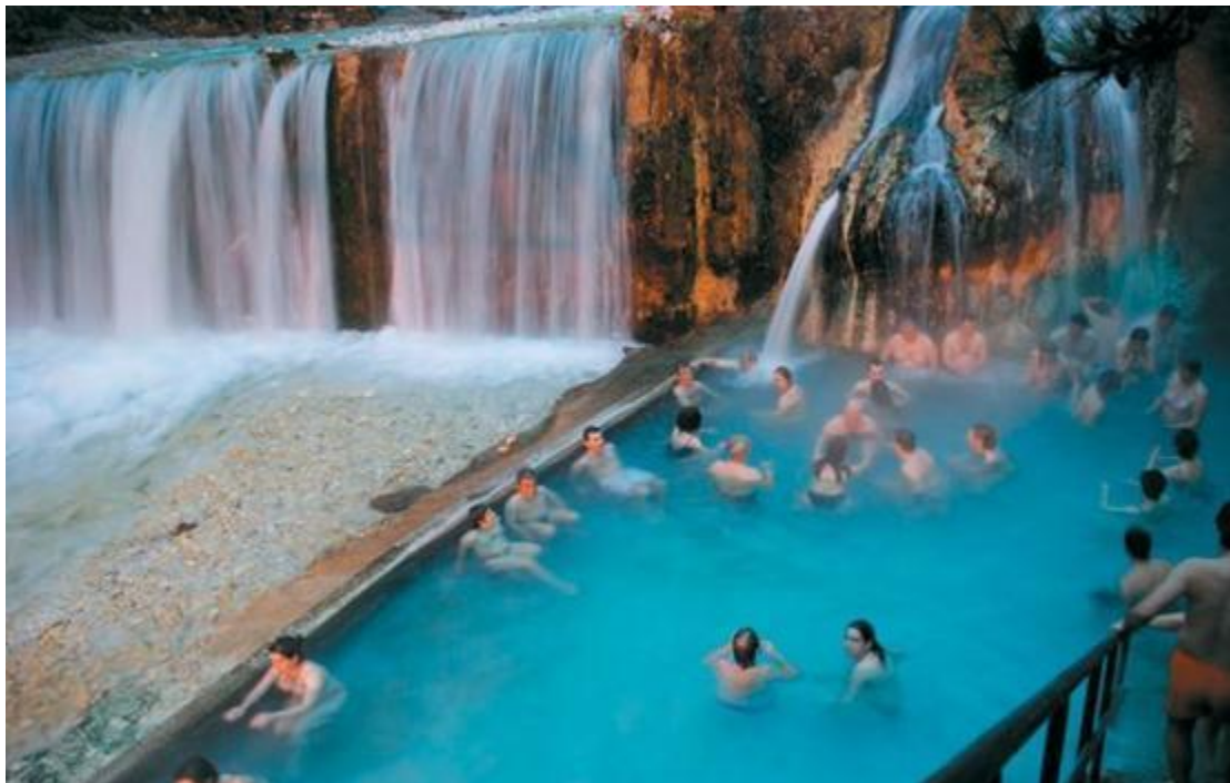
Εικόνα 12 Ιαματικά λουτρά Καμένων Βούρλων