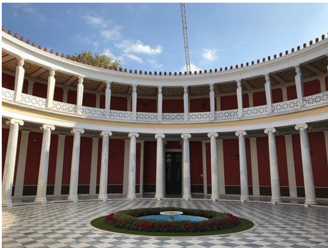
Εικόνα 30 Ζάππειο Μέγαρο

Τα κυριότερα εκθεσιακά κέντρα της Ελλάδας είναι: