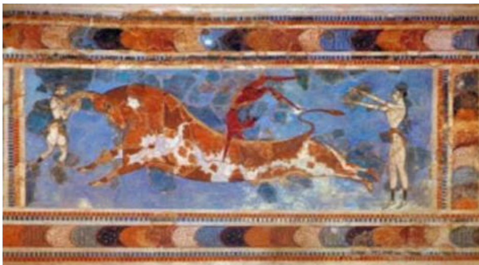
Εικόνα 2 Μινωική τοιχογραφία

Ακόμα περιλαμβάνει τη συμμετοχή σε ενεργητικές δραστηριότητες όπως είναι η εκμάθηση μιας τοπικής μαγειρικής ή η συμμετοχή σε λαογραφικές δραστηριότητες. Όπως και σε παθητικές δραστηριότητες, για παράδειγμα η παρακολούθηση καλλιτεχνικών εκδηλώσεων (θεατρικών παραστάσεων κλπ), διάφορες επισκέψεις σε μουσεία και αρχαιολογικούς χώρους και περιηγήσεις σε πολιτιστικές διαδρομές. Η στενή και ουσιαστική επαφή που αποκτούν οι επισκέπτες με τα ήθη και τις παραδόσεις του τοπικού πληθυσμού, σε συνδυασμό με τα πολιτισμικά δρώμενα της εκάστοτε περιοχής, αποτελούν μια άλλη σημαντική παράμετρος που χαρακτηρίζει τον πολιτιστικό τουρισμό.