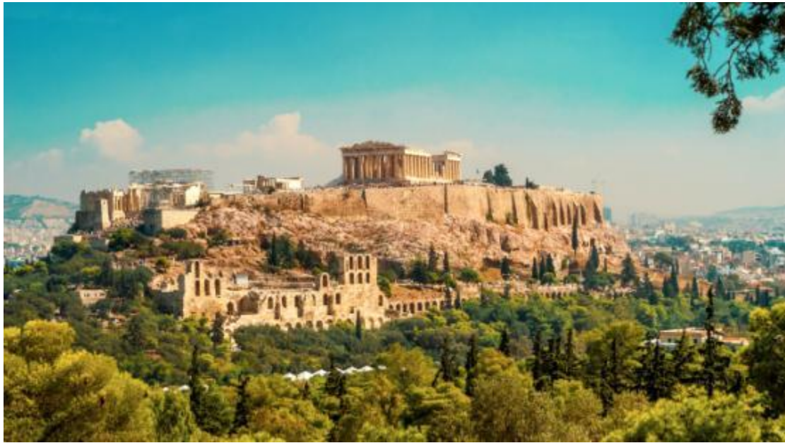
Εικόνα 4 Ακρόπολη Αθηνών