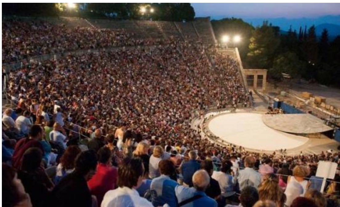
Εικόνα 7 Φεστιβάλ Επιδαύρου

Μάλιστα, μερικές από τις σημαντικότερες εκδηλώσεις που πραγματοποιούνται στα πλαίσια των καλοκαιρινών πολιτιστικών εκδηλώσεων - φεστιβάλ, είναι το Φεστιβάλ Αθηνών (διοργανώνεται κατά τη διάρκεια των καλοκαιρινών μηνών), το Φεστιβάλ Επιδαύρου (θέατρο) καθώς και ο Μουσικός Ιούλιος που λαμβάνει χώρα στην Επίδαυρο. Και τα τρία αυτά φεστιβάλ θεωρούνται από τα σπουδαιότερα καλλιτεχνικά φεστιβάλ ολόκληρης της Ευρώπης.