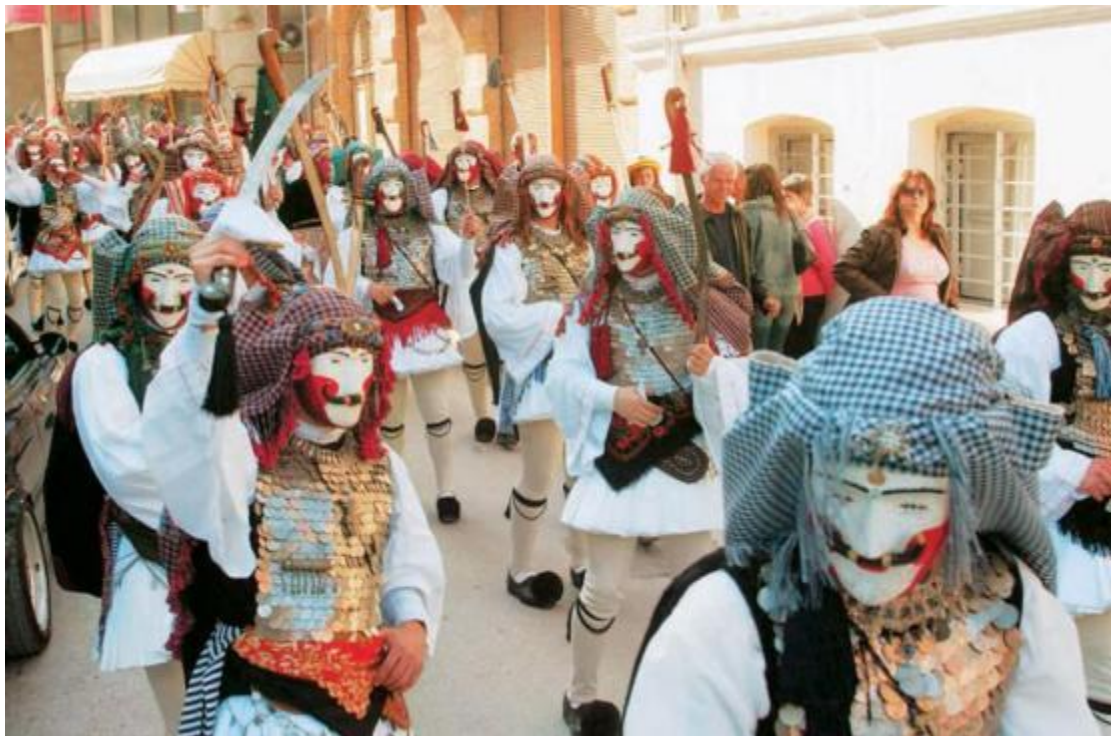
Εικόνα 6 Γενίτσαροι και μπούλες (καρναβάλι Νάουσας)