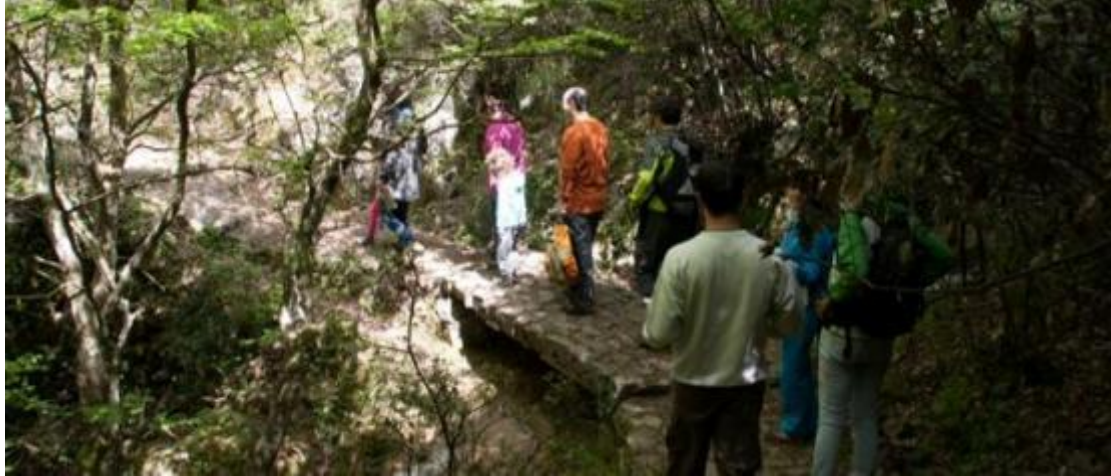
Εικόνα 17 Πεζοπορία στο φαράγγι του Λούσιου

Διάσημες διαδρομές trekking (trekking είναι πεζοπορία μέσα σε μονοπάτια και διαδρομές στο βουνό, με συνοδεία επαγγελματιών οδηγών βουνού)