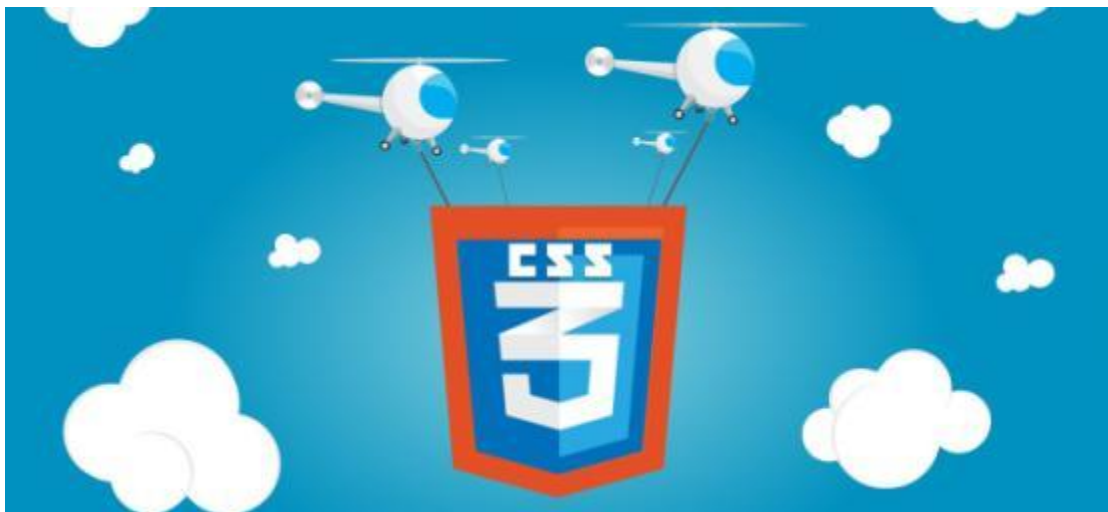
Εικόνα 33 CSS3

Από τη CSS1 που προτάθηκε το 1996 και τη CSS2 το 1998 δεν υπήρξαν μεγάλες αλλαγές, εκτός από μία αναθεώρηση το 2011 με την CSS2.1. Η CSS3 φέρνει πάρα πολλές αλλαγές στο τομέα του σχεδιασμού των ιστοσελίδων. Ίσως η σημαντικότερη από αυτές είναι ο διαχωρισμός σε ορίσματα (modules). Ενώ με τις προηγούμενες εκδόσεις της CSS όλη εμφάνιση της ιστοσελίδας καθοριζόταν από ένα ενιαίο κώδικα που καθόριζε τα επιμέρους χαρακτηριστικά, στη CSS3 έχουμε διαχωρισμό των κειμένων του κώδικα σε ορίσματα. Καθένα από αυτά τα ορίσματα έχουν τα δικά τους χαρακτηριστικά και δυνατότητες.