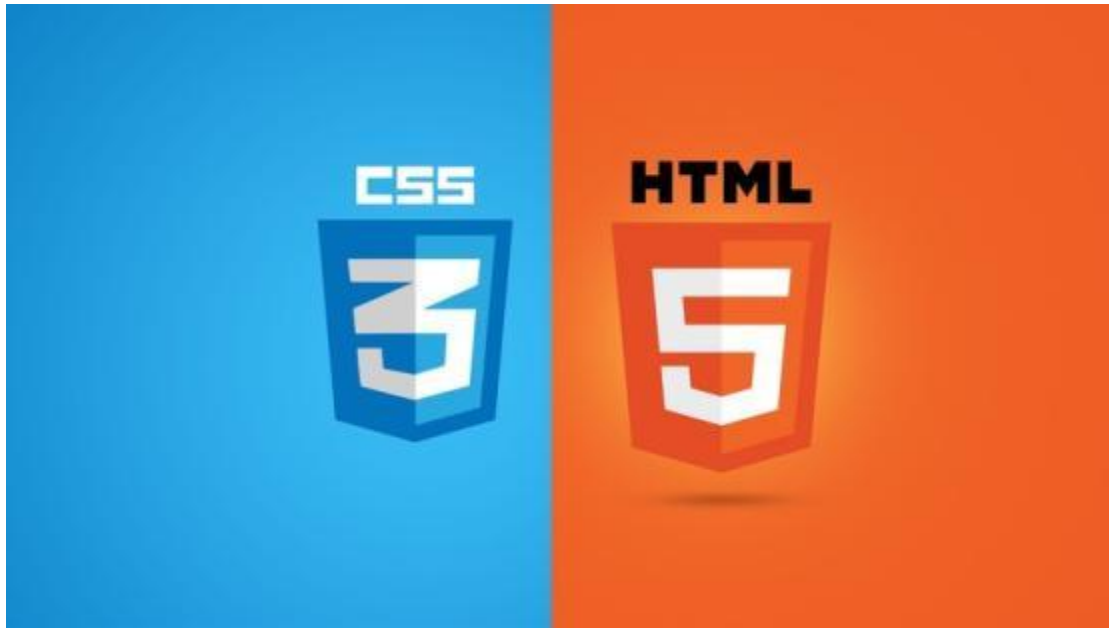
Εικόνα 34 HTML5 + CSS3

Γενικά οι HTML5 και CSS3 θεωρούνται αλληλένδετες και η όλη φιλοσοφία της ανάπτυξής τους στηρίζεται στην απόλυτη μεταξύ τους συνεργασία προκειμένου να πετύχουν τα καλύτερα δυνατά αποτελέσματα στην ανάπτυξη και το σχεδιασμό ιστοσελίδων. Πλέον όλες οι ενημερωμένες εκδόσεις των περισσότερων φυλλομετρητών τις υποστηρίζουν σε διαφορετικό βαθμό όμως η κάθε μία. Περισσότερες πληροφορίες σχετικά με το συγκεκριμένο θέμα μπορούν να αντληθούν από την ιστοσελίδα: http://caniuse.com/