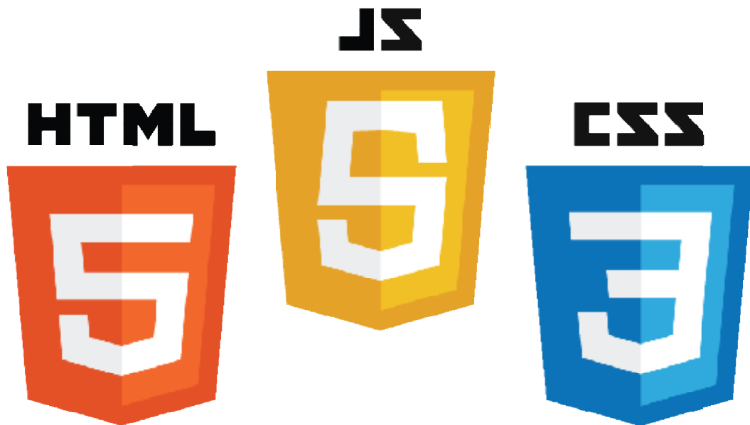
Εικόνα 38 HTML5 + CSS3 + JS

απαντήσεις στο ερώτημα αναζήτησης, πριν ακόμη ο χρήστης ολοκληρώσει την πληκτρολόγησή του ή στο καλάθι ενός ηλεκτρονικού καταστήματος η JavaScript μπορεί να εκτελέσει υπολογισμούς που να αφορούν τα συνολικά ποσά πληρωμής, το πλήθος των προϊόντων, ή τα κόστη αποστολής. Σε μία ιστοσελίδα όπου ο χρήστης χρειάζεται επιπλέον βοήθεια για να καταλάβει τη λειτουργία της, η JavaScript μπορεί να εμφανίζει αναδυόμενα παράθυρα με τις κατάλληλες πληροφορίες.