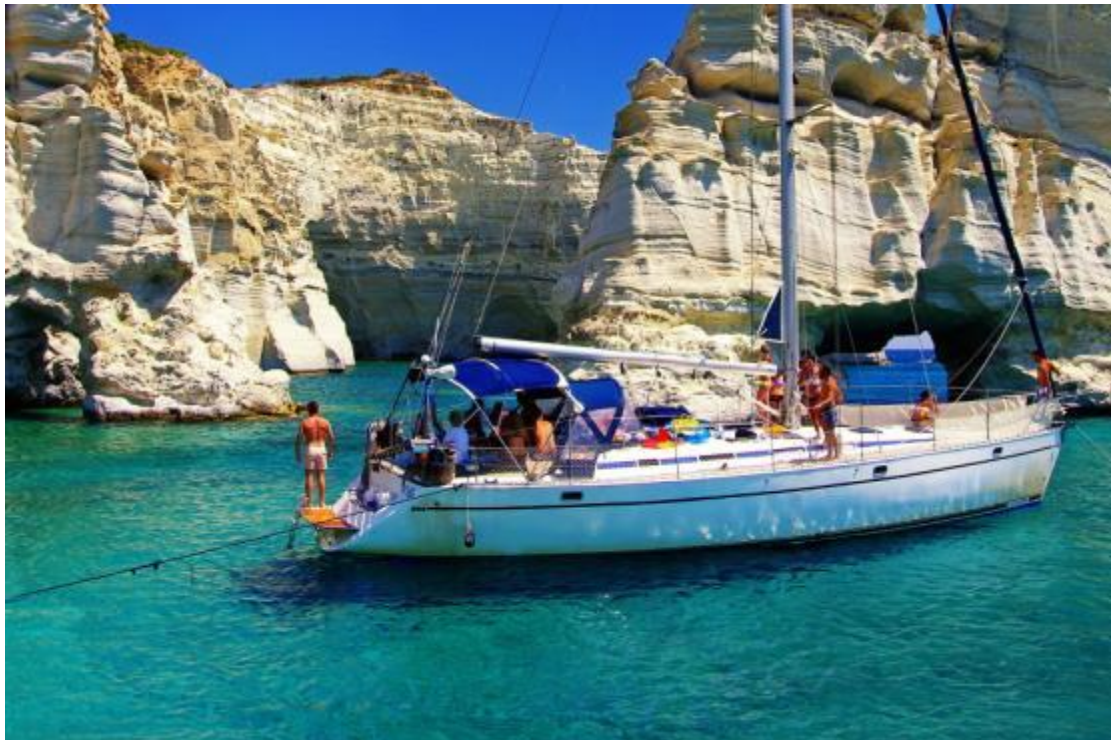
Εικόνα 25 Ιστιοπλοΐα στη Μήλο

Η ιστιοπλοΐα είναι ένα άθλημα που συνδέεται άρρηκτα τον ελληνικό λαό, μέσα από τη μακρόχρονη ιστορία της χώρας και τη μακραίωνη θαλασσινή παράδοσή της. Σήμερα, είναι ένα από τα δημοφιλέστερα αθλήματα και χιλιάδες Έλληνες ασκούνται συστηματικά (ως πρωταθλητές ή απλοί αθλητές) σε όλους τους τύπους ιστιοπλοϊκών σκαφών.