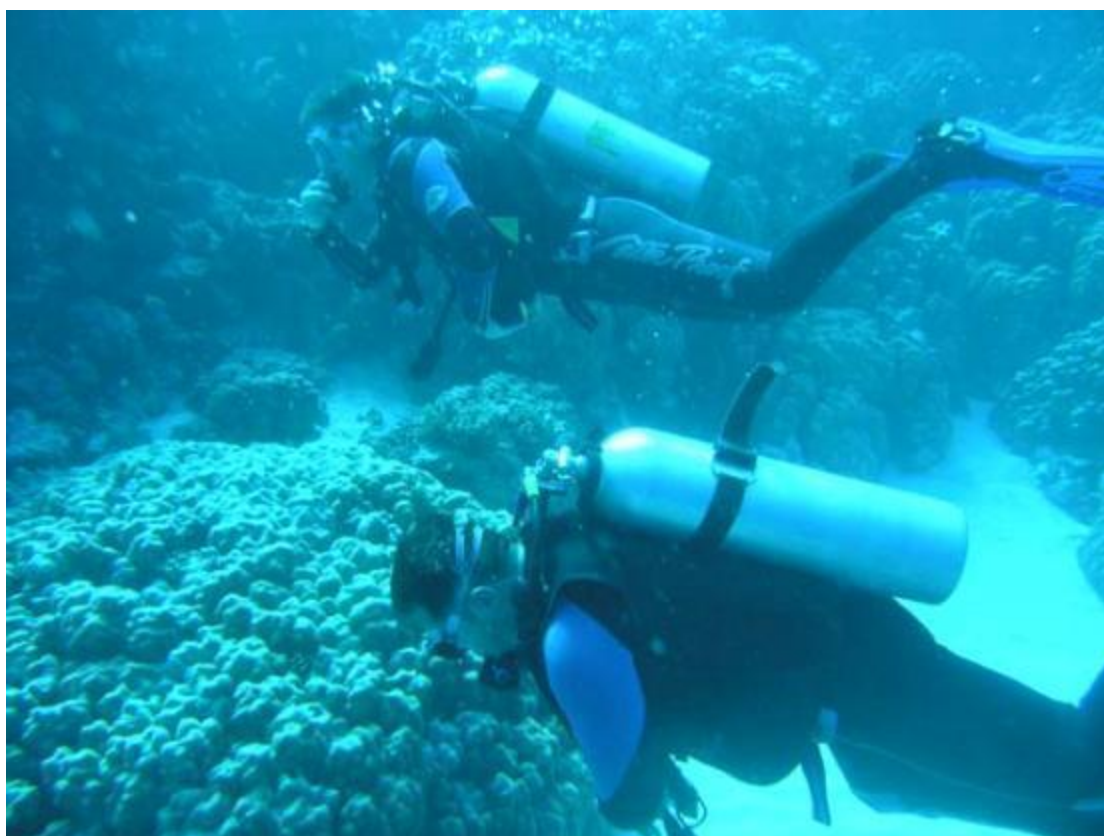
Εικόνα 27 Αυτόνομη κατάδυση

Η ιδιαίτερη καθαρότητα των ελληνικών θαλασσών και ο τεράστιος πλούτος του βυθού, αποτελούν πόλο έλξης για όσους αναζητούν τη μαγεία της υποβρύχιας εξερεύνησης. Με μάσκα επιτρέπεται παντού η ελεύθερη κατάδυση, αλλά η κατάδυση με τη χρήση φιαλών ατμοσφαιρικού αέρα (80% άζωτο + 20% οξυγόνο) απαγορεύεται σε περιοχές με υποθαλάσσιες αρχαιοτήτες. Στην Ελλάδα λειτουργούν δεκάδες σχολές καταδύσεων, που υπόκεινται σε ειδική άδεια του υπουργείου Εμπορικής Ναυτιλίας. Όλοι οι αυτοδύτες υποχρεούνται να συμφωνούν και να τηρούν τους κανονισμούς και τους περιορισμούς του νόμου 5351/32 περί αρχαιοτήτων. Υποβρύχια δραστηριότητες με καταδυτικό εξοπλισμό επιτρέπονται από την ανατολή μέχρι τη δύση του ηλίου. Ειδικότερα, οι ενδιαφερόμενοι θα πρέπει να γνωρίζουν ότι απαγορεύεται: -το ψάρεμα με εξοπλισμό αυτόνομης κατάδυσης (το ψαροντούφεκο με μπουκάλες). -η φωτογράφιση, η αφαίρεση ή η μεταφορά αρχαιοτήτων. Σε περίπτωση εντοπισμού αρχαίων πρέπει αμέσως να το αναφέρετε στην πλησιέστερη αρχαιολογική υπηρεσία του υπουργείου Πολιτισμού (ή στην Εφορεία Εναλίων Αρχαιοτήτων), λιμενική ή αστυνομική αρχή. -η χρήση και κατοχή (πάνω σε πλοίο) ειδικού εξοπλισμού ανεύρεσης αρχαιοτήτων.