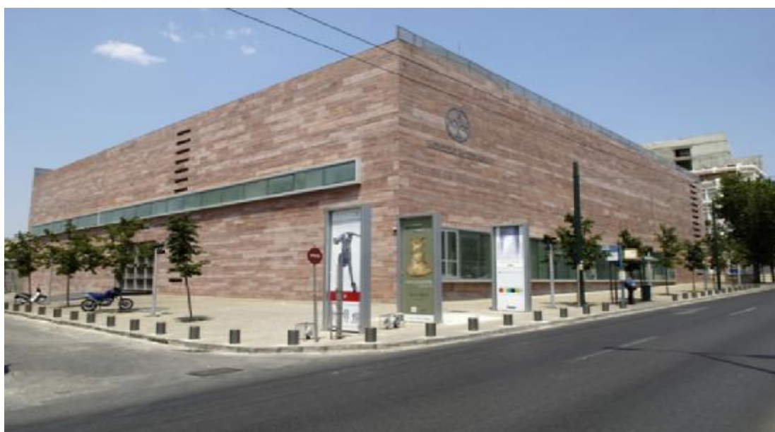
Εικόνα 11. Μουσείο Μπενάκη

Η εθελοντική δράση στο Μουσείο Αφής είναι πολύ ενδιαφέρουσα. Εκτός από την υποστήριξη της λειτουργίας του Μουσείου, ο εθελοντής συμμετέχει στην ξενάγηση των επισκεπτών, επιβλέπει τη λειτουργία του Μουσείου, προτείνει νέες δραστηριότητες και γενικότερα συμμετέχει στην εξέλιξη του. Οι εμπειρίες που αποκομίζει από τη σχέση του με τους επισκέπτες, που ψηλαφίζουν τα εκθέματα, ιδιαίτερα από τον ευαίσθητο χώρο της Τυφλότητας, είναι μοναδικές. Το Μουσείο Αφής στηρίζεται στους Εθελοντές και επιδιώκει την προσέλκυση νέων εθελοντών.