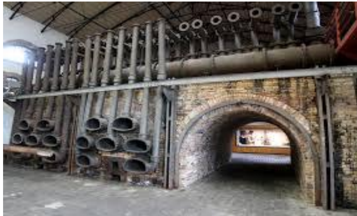
Εικόνα 14. Βιομηχανικό Μουσείο Φωταερίου

Το περιοδικό ΣΕΚΟΪΑ με ταχυδρομική παραλαβή.