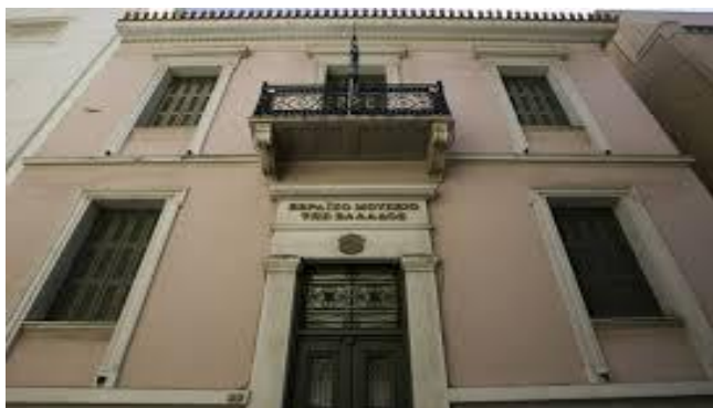
Εικόνα 12. Εβραϊκό Μουσείο Ελλάδας

Αποστολή δήλωσης ενδιαφέροντος και βιογραφικού στο volunteers@benaki.gr