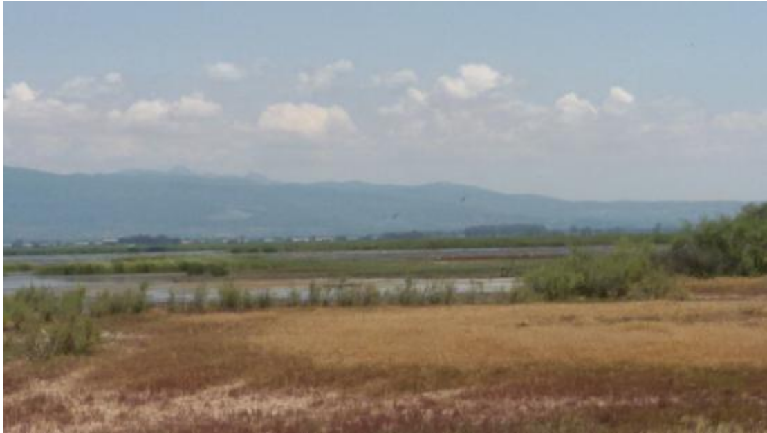
Εικόνα 2: Έλος στον υγρότοπο Κοτυχίου-Στρομφυλίας.