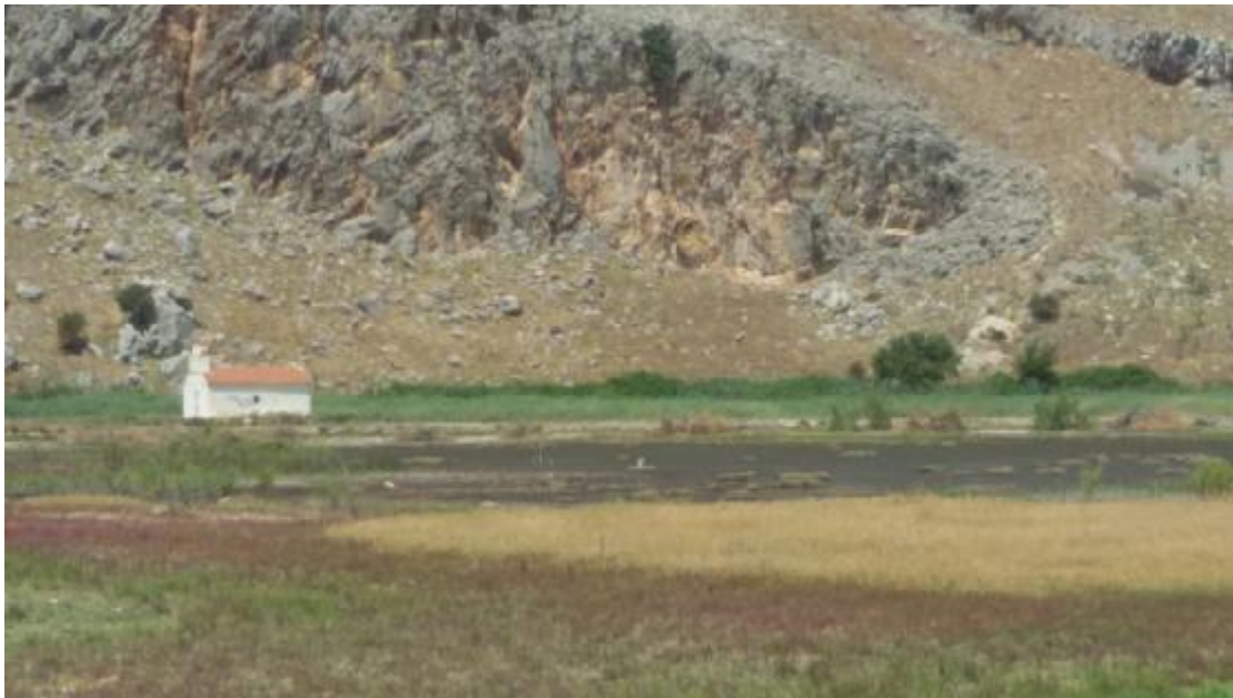
Εικόνα 1: Το ξοκλήσι στον υγρότοπο Κοτυχίου-Στρομφυλίας.