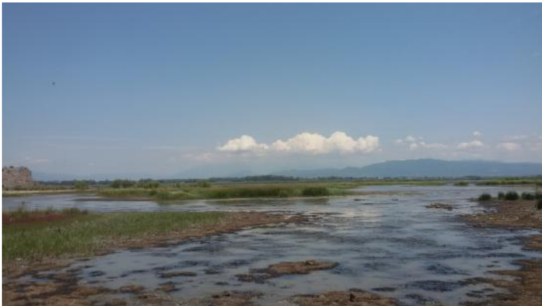
Εικόνα 3: Υγρότοπος Κοτυχίου-Στρομφυλίας.