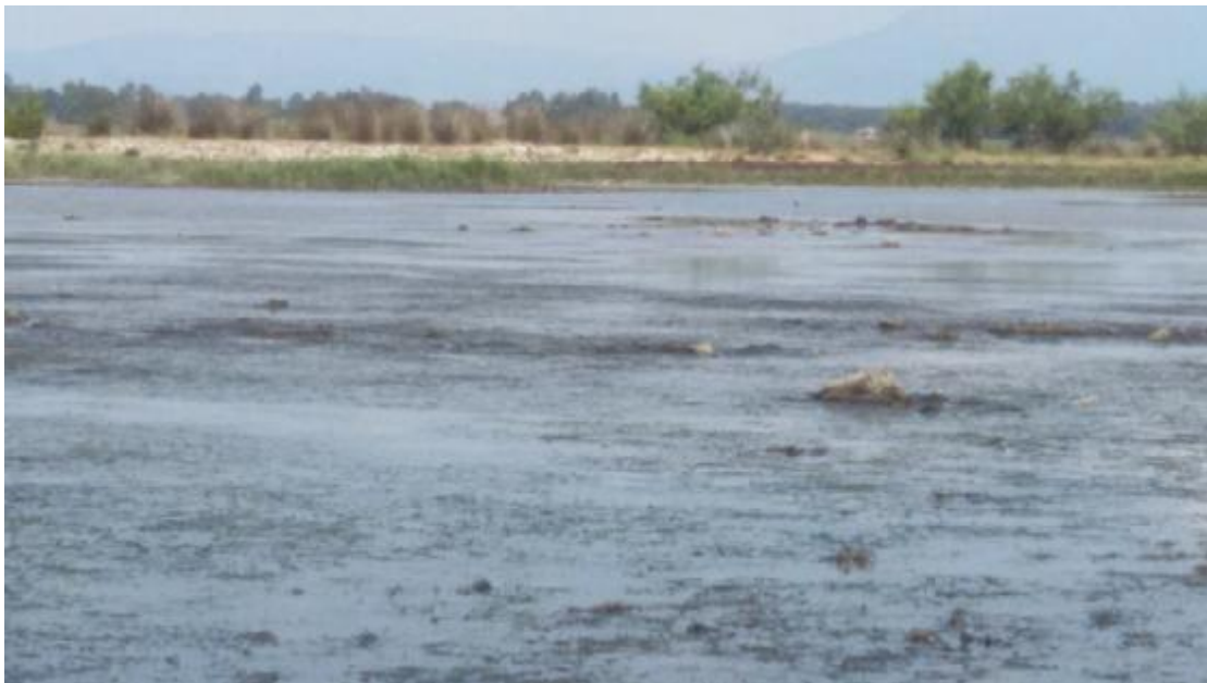
Εικόνα 5: Λήψη πτηνών στον Υγρότοπο Κοτυχίου-Στρομφυλίας.