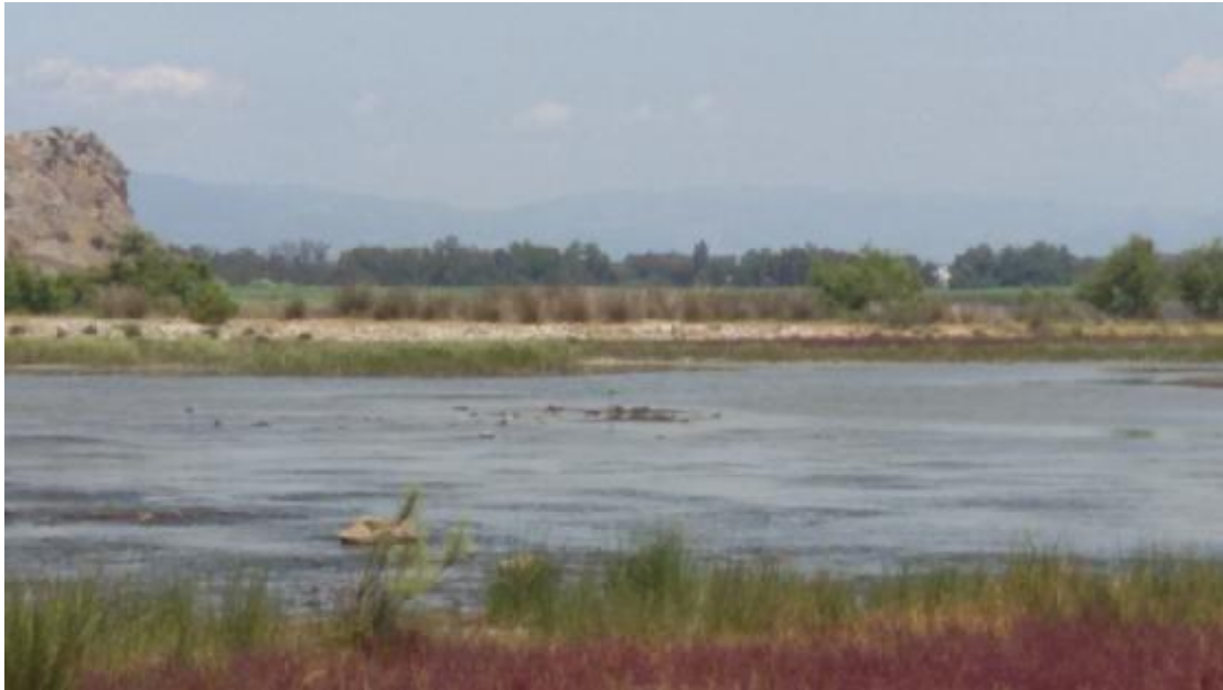
Εικόνα 4: Προσπάθεια λήψης πελεκάνων στον Υγρότοπο Κοτυχίου-Στρομφυλίας.