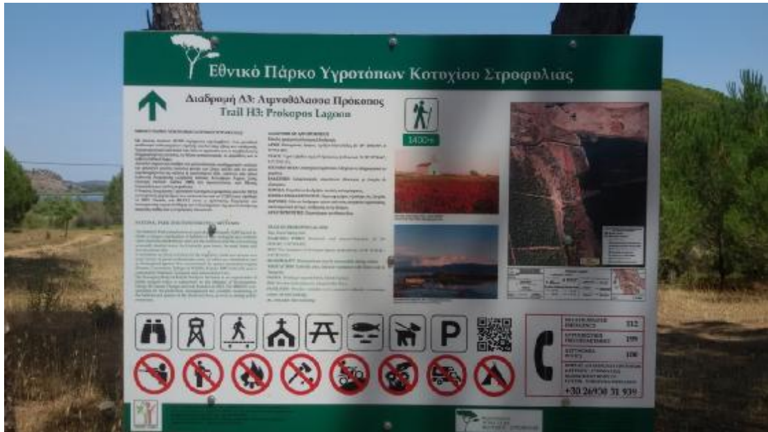
Εικόνα 6: Πανακίδα πληροφοριών Υγροτόπου Κοτυχίου-Στροφυλίας.