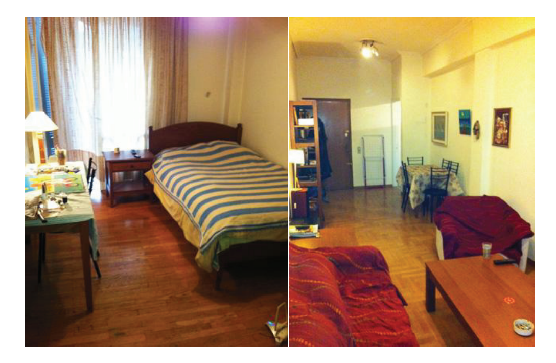
Εικόνες 5 & 6: Φωτογραφίες από τους εσωτερικούς χώρους του Προστατευόμενου Διαμερίσματος