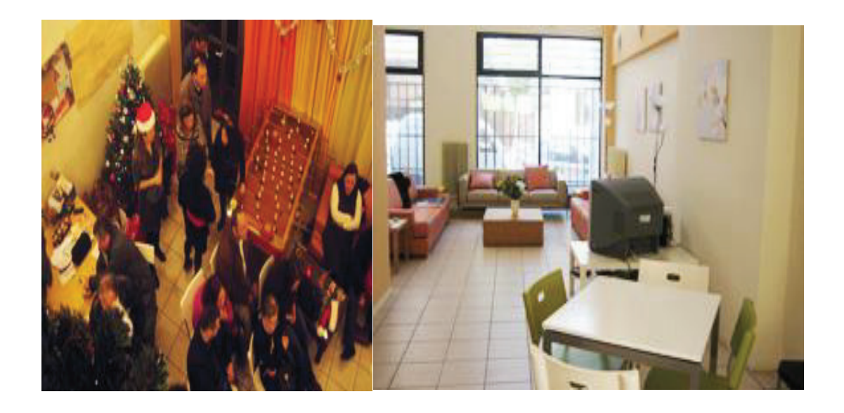
Εικόνα 2: Φωτογραφία από εκδήλωση