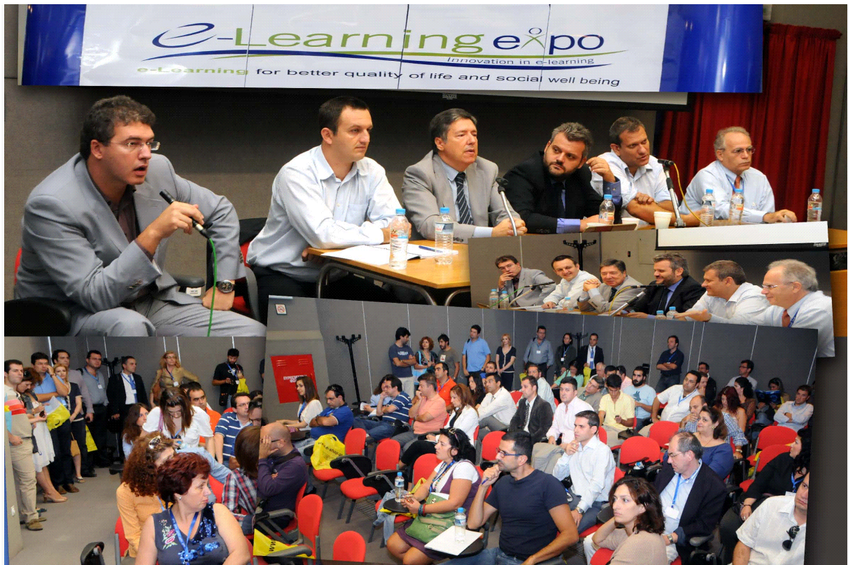
Εικόνα 3 Στιγμιότυπα από σεμινάριο στο Εκπαιδευτικό κέντρο της Εθνικής Τράπεζας.