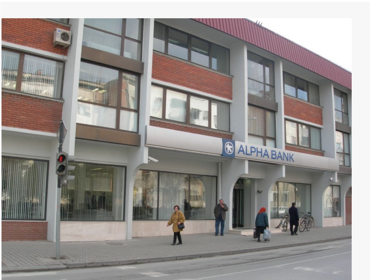
Εικόνα 6 Κατάστημα της Αλφα Τράπεζας στην Σερβία