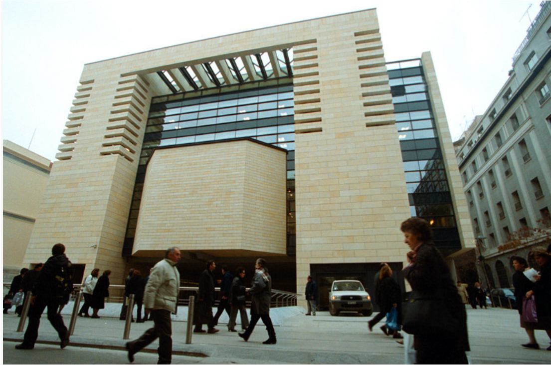
Εικόνα 7 Το κτήριο-καύχημα της Εθνικής στην Αιόλου