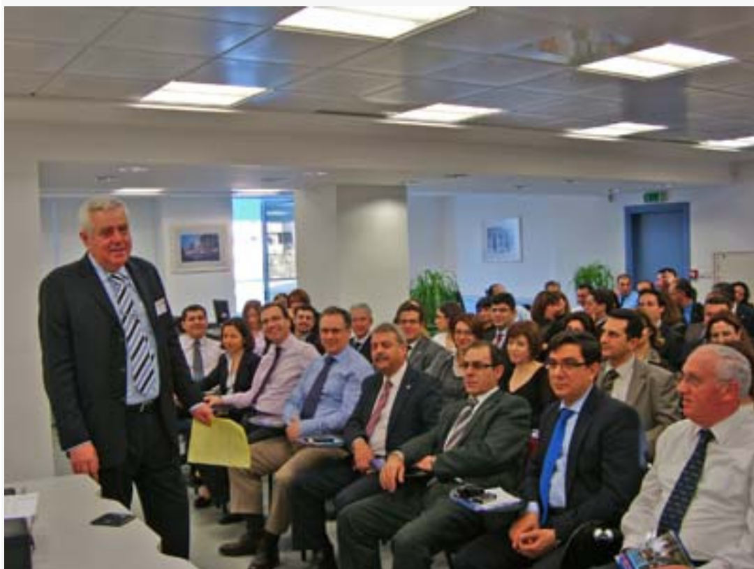
Εικόνα 4 Σεμινάριο σε στελέχη στην Alpha Τράπεζας.