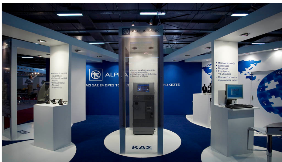
Εικόνα 2 Μία μοντέρνα παρουσία της Αλφα Τράπεζας σε κλαδική έκθεση