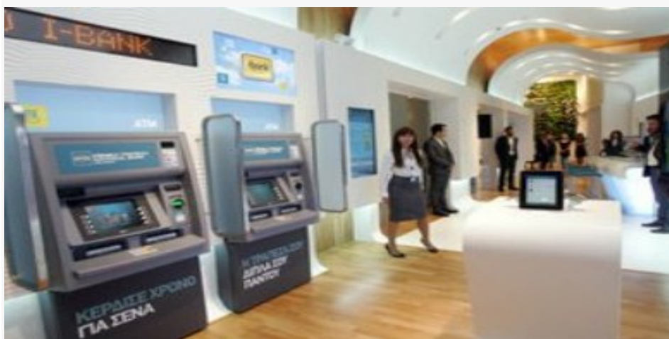
Εικόνα 1 Το πιο σύγχρονο τραπεζικό κατάστημα της Εθνικής. Στο "The Mall Athens"