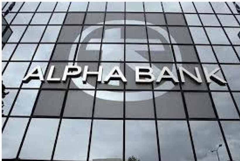
Εικόνα 8 Σύγχρονο κτήριο της Άλφα Τράπεζας στην Λ. Αθηνών