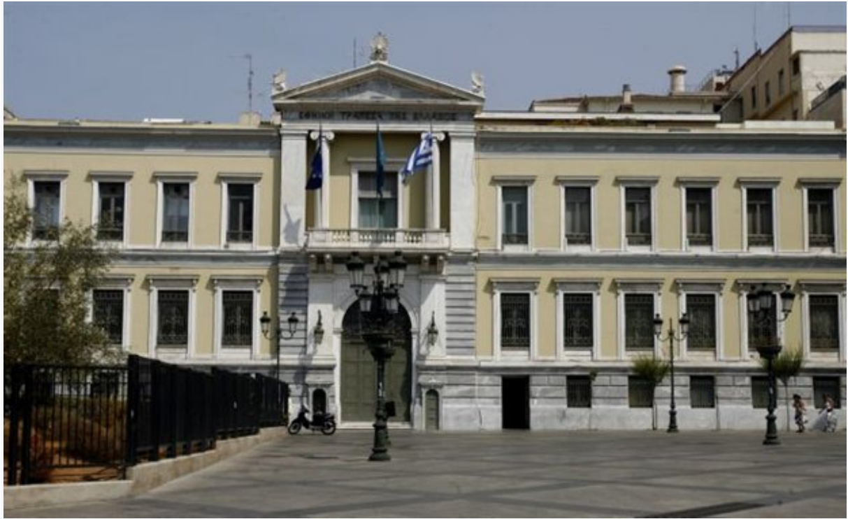
Εικόνα 5 Το κεντρικό κατάστημα της Εθνικής στην Πλατεία Κοντζιά