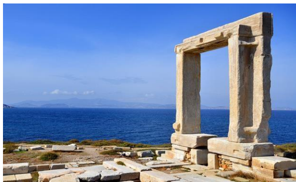
Εικόνα 18: Ναός του Απόλλωνα ( Πορτάρα).

Το Βυζαντινό Μουσείο του νησιού στεγάζεται σε ένα από τα πιο επιβλητικά κτήρια του Κάστρου, ένα πύργο με τέσσερα επίπεδα και απίστευτη θέα προς το λιμάνι. Είναι ο μοναδικός πύργος που σώθηκε από τους δώδεκα που υπήρχαν. Σήμερα το κτήριο, που είναι πλήρως αναστηλωμένο, λειτουργεί σαν βυζαντινό μουσείο των Κυκλάδων και φιλοξενεί μια πολύ αξιόλογη έκθεση βυζαντινής γλυπτικής από τη Νάξο και τις Κυκλάδες της περιόδου από τον 7ο έως τον 12ο αιώνα. Τα οικοίσημα των Μπαρότση και Κρίστι υπενθυμίζουν δύο από τους ιδιοκτήτες του που υπήρξαν αρχικά στο νησί (Ιερή Αρχιεπισκοπή Αθηνών, no date).