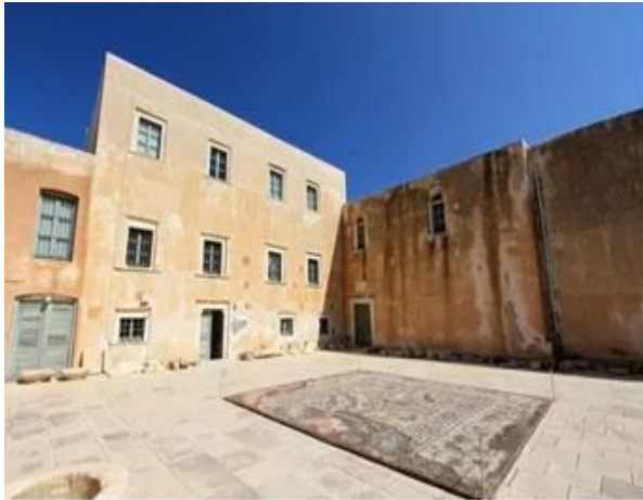
Εικόνα 16: το Αρχαιολογικό Μουσείο