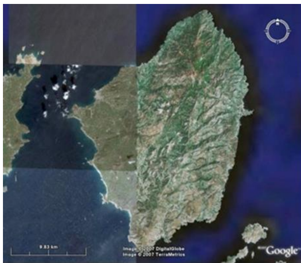
Εικόνα 3 : Η Νάξος από δορυφόρο.