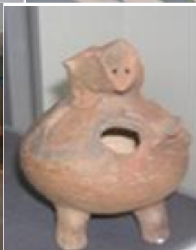
Εικόνα 5 :

Πρωτοκυκλαδικά ευρήματα από διάφορα μουσεία του κόσμου: Αριστερά: Badisches Landesmuseum, Καρλσρούη, Πάνω δεξιά: Altes Museum, Βερολίνο, Κάτω δεξιά: British Museum, Λονδίνο.