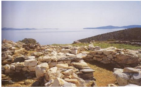
Εικόνα 2: Η πρωτοκυκλαδική ακρόπολη στο Κορφάρι των Αμυγδαλιών στον Πάνορμο, στη ΝΑ ακτή του νησιού. Στο βάθος διακρίνονται τα νησάκια Σχινούσα και Κάτω Κουφονήσι.

Τα Γεωργικά και τα κτηνοτροφικά προϊόντα δίνουν στο νησί οικονομική αυτάρκεια. Τα προϊόντα που παράγουν είναι η πατάτα, το κίτρο, το λάδι και το κρασί. Εσπεριδοειδή και λαχανικά. Επίσης, φημίζεται για την γραβιέρα, την ξυνομυζήθρα, το ανθότυρο και τα λουπά. Οι Ναξιώτες είναι άνθρωποι φιλόξενοι και γλεντζέδες που τιμούν τα έθιμα και τις παραδόσεις τους ( Τα όνειρα ζωντανεύουν στις Κυκλάδες, no date).