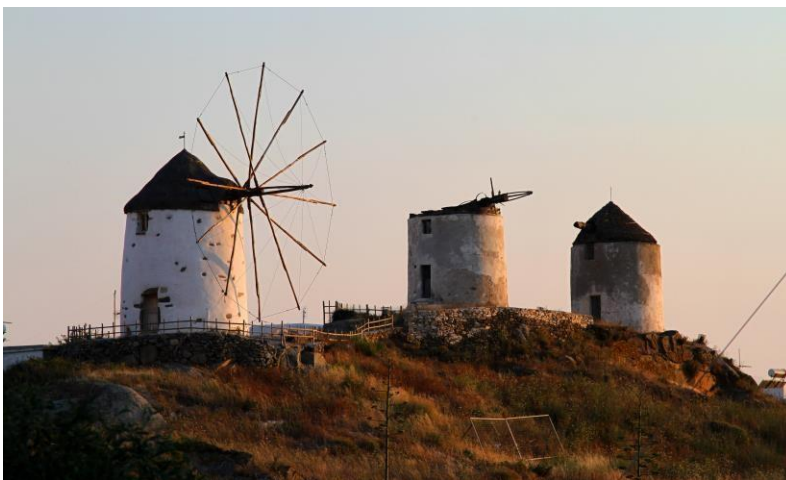
Εικόνα 21: 1 η

φωτογραφία χορευτικό Κινιδάρου και 2 η φωτογραφία Τρίποδες Νάξου. Πηγή: