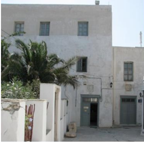
Εικόνα 11: Η εμπορική σχολή των Ιησουιτών μοναχών, που σήμερα φιλοξενεί το αρχαιολογικό μουσείο της Νάξου.