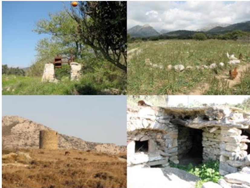
Εικόνα 12 : Μαγανοπήγαδο (πάνω αριστερά), ερειπωμένος ανεμόμυλος (κάτω αριστερά), αλώνι (πάνω δεξιά), και μιτάτο (κάτω δεξιά).