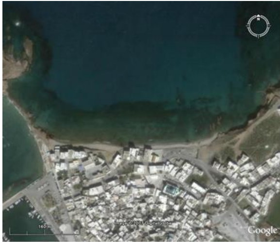
Εικόνα 6 : Τμήμα της βυθισμένης μυκηναϊκής πόλης της Γρόττας, που εντοπίζεται βόρεια της σημερινής παραλίας