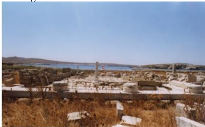
Εικόνα 8: Ο «Οίκος των Ναξίων» στη Δήλο, ενδεικτικό της παρουσίας τους στη Δήλο τον 7ο αι. Πηγή: Λεκάκης Σ.