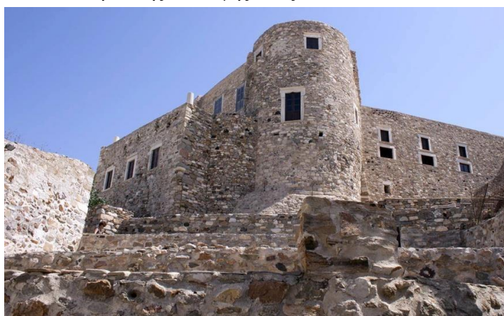
Εικόνα 15 : Κάστρο Νάξου.

2 η Μέρα Επίσκεψη στο Κάστρο της Νάξου όπου μέσα εκεί βρίσκεται το Αρχαιολογικό Μουσείο και το Βυζαντινό Μουσείο αυτά βρίσκονται στην Χώρα της Νάξου οπότε και εννοείται ότι μετά θα επισκεφθούν και την Πορτάρα. Η μεταφορά τους θα γίνει με τουριστικό λεωφορείο που διαθέτει και ξεναγό. Τελειώνοντας την ξενάγηση θα μπορούν να περπατήσουν στα σοκάκια της Νάξου και να γευματίσουν σε εστιατόριο της επιλογής τους.