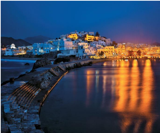
Εικόνα 23 : 1 η φωτογραφία Παλιά αγορά Νάξος ,2 η φωτογραφία Χώρα Νάξος .