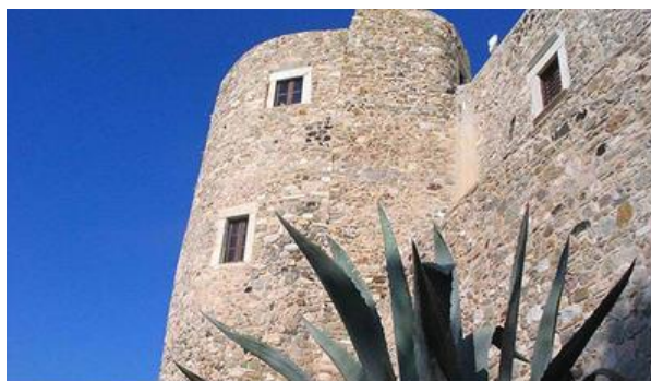
Εικόνα 17: Βυζαντινό Μουσείο.