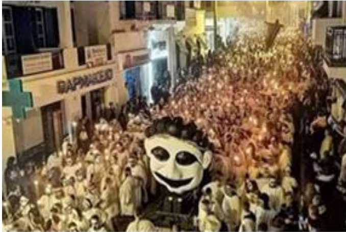
Εικόνα 31: Λαμπαδηφορίες Νάξου.

Πρόκειται για μια πολύ ιδιαίτερη και επιβλητική παρέλαση η ιστορία της οποίας συνδέεται με την αρχαία Ελλάδα. Αποτελεί ένα κράμα Απολλώνιων και Διονυσιακών στοιχείων. Είναι ένα σχετικά πρόσφατο έθιμο όπου παίρνει μέρος το τελευταίο Σάββατο των Αποκριών. Πλήθος κόσμος ανηφορίζει στο Κάστρο της Χώρας ντυμένος με ένα άσπρο σεντόνι και βάζονται στο πρόσωπο τους με μαύρη μπογιά την περιοχή γύρω από τα μάτια ενώ το υπόλοιπο πρόσωπο με λευκή μπογιά. Στα μαλλιά τους τοποθετούν στάχια και στα χέρια κρατούν αναμμένες δάδες. Από το Κάστρο θα κατέβουν στην παραλία όπου στην κεντρική πλατεία θα κάψουν το κακό πνεύμα. Η ρακή ρέει άφθονη, ήχοι από κρουστά ακούγονται παντού ο κόσμος διασκεδάζει με χορούς και τραγούδια που κρατούν μέχρι το άλλο πρωί (naxos carnival, 2021).