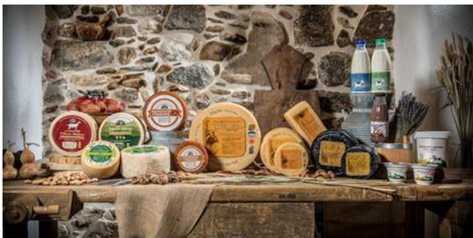
Εικόνα 13: Τοπικά προϊόντα Νάξου.

Η πατάτα , το γάλα , τα τυροκομικά , το κρασί , το κίτρο , το λάδι και το θυμαρίσιο μέλι είναι τα πιο φημισμένα στο νησί ( Μαστοροπούλου Σ., 2019).