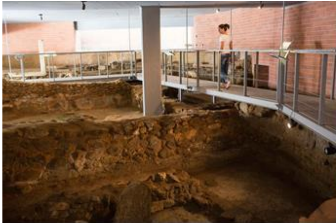
Εικόνα 27 : Επιτόπιο Μουσείο.