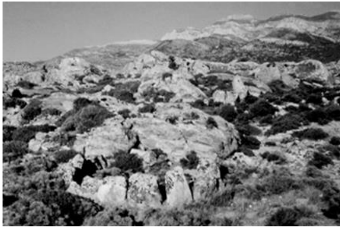
Εικόνα 7: Κυκλικοί περίβολοι ταφών στο Τσικαλαριό