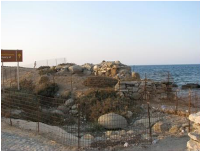
Εικόνα 4 : Η θέση