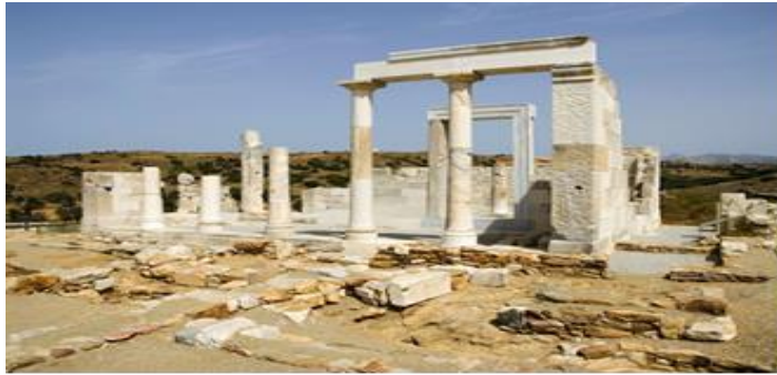
Εικόνα 20 : Ναός της Δήμητρας.