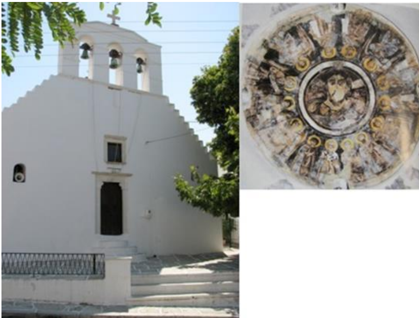
Εικόνα 10 :