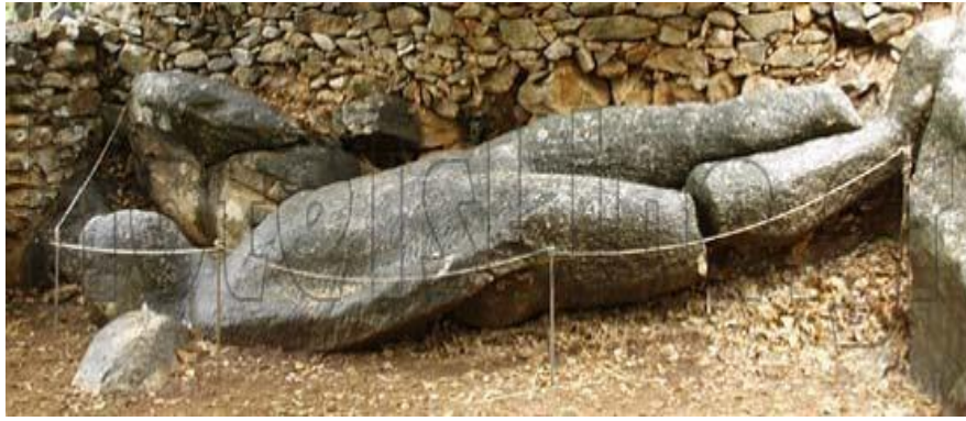
Εικόνα 28 : Κούρος στο Φλεριό.