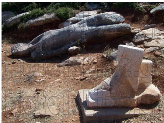
Εικόνα 29: Κούρος στην Ποταμιά.

Ο Κούρος στο Φλεριό Μελάνων παριστάνει ένα γυμνό νέο άνδρα σε υπερφυσικό μέγεθος με ύψος 5,5 μ. και στην αρχαϊκή μετωπική, αδρανή στάση. Χρονολογείται γύρω στο 570 π.Χ. Είναι η εποχή που οι ισχυροί ευγενείς μιας αριστοκρατικής κοινωνίας παραγγέλνουν μνημειώδη έργα που επιβάλλονται με την αυστηρή δομή και το μέγεθος τους. Η τεχνοτροπία των Ναξίων γλυπτών χαρακτηρίζεται από λεπτές αναλογίες, και περιγράμματα (HotelsLine.gr, 2000-2012). Αυτός ο Κούρος ονομάστηκε Έλληνας γιατί προφανώς αντιπροσώπευε αξίες όπως το «μέγεθος» και τη «δύναμη» που ταυτίζονται με τον Έλληνα.